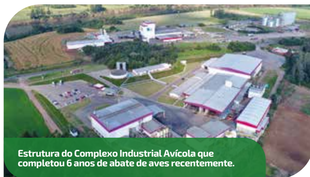
Estrutura do Complexo Industrial Avícola que completou 6 anos de abate de aves recentemente.