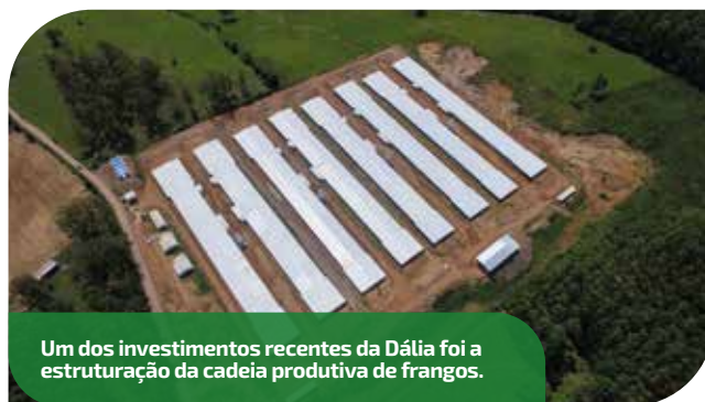
Um dos investimentos recentes da Dália foi a estruturação da cadeia produtiva de frangos.