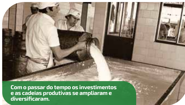
Com o passar do tempo os investimentos e as cadeias produtivas se ampliaram e diversificaram.