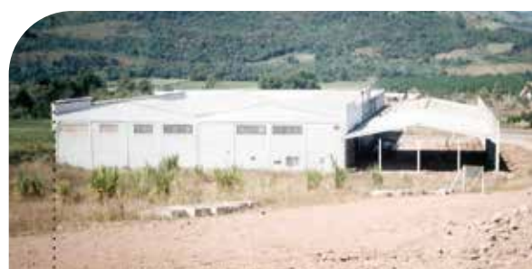
Ampliação e mudança para nova área com 2.400m 2 em 2004.