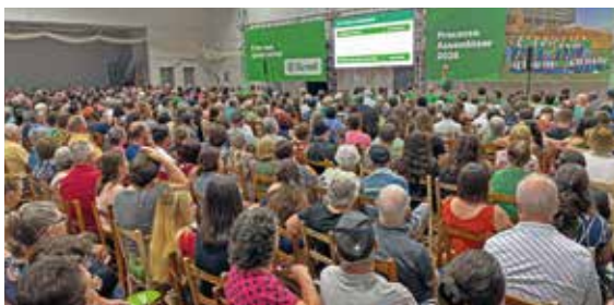
23/03 - RELVADO