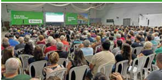
30/03 - SÃO VALENTIM DO SUL