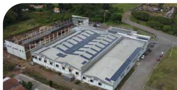
Prédio atual com 5.100 m 2 , que está em ampliação.