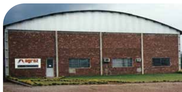
Primeira estrutura fabril de 840 m 2 em 2001.