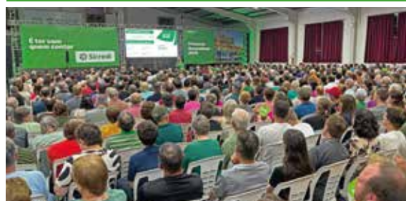
19/03 - DOIS LAJEADOS