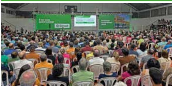
25/03 - NOVA BRÉCIA