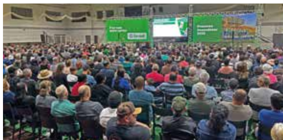
24/03 - COQUEIRO BAIXO