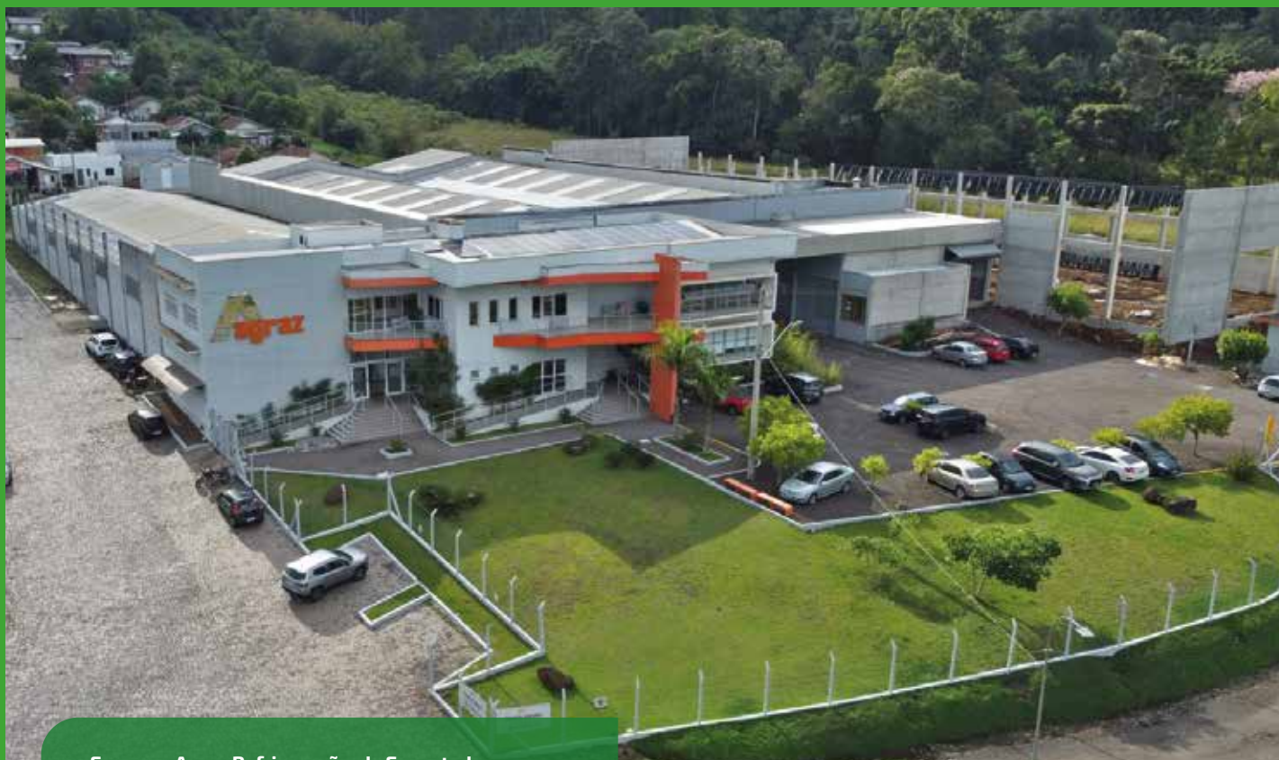
Empresa Agraz Refrigeração, de Encantado.