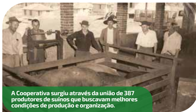
A Cooperativa surgiu através da união de 387 produtores de suínos que buscavam melhores condições de produção e organização.