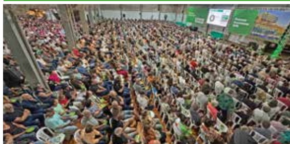
08/04 - ENCANTADO