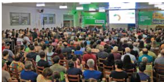
16/03 - VISTA ALEGRE DO PRATA