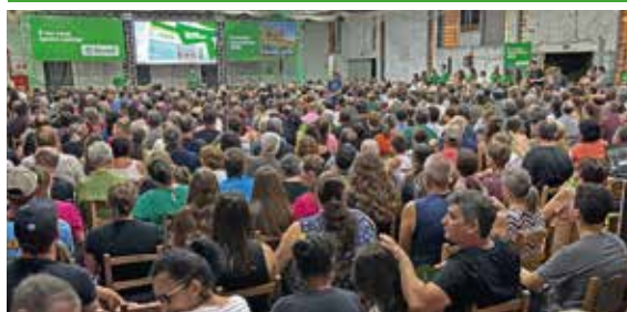
06/04 - ROCA SALES