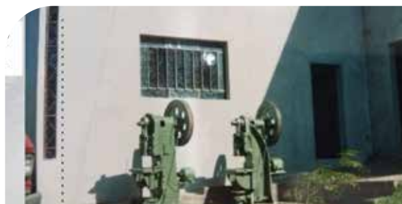
Primeiros equipamentos para estruturação industrial adquiridos em 1998.

Em um período em que o mercado ainda não exigia esse diferencial, a decisão de buscar a ISO foi estratégica para estruturar procedimentos, padronizar rotinas, estabelecer políticas e criar uma identidade organizacional clara. A certificação contribuiu para que a Agraz passasse a falar a linguagem da indústria, garantindo mais credibilidade junto aos clientes. Esse movimento permitiu à empresa crescer com qualidade, coerência e consistência e preparou o negócio para atender clientes com altos padrões de exigência.