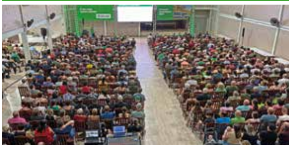
01/04 - MUÇUM