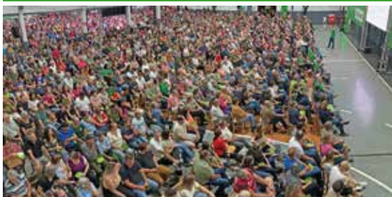
07/04 - ARROIO DO MEIO