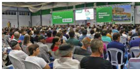
17/03 - UNIÃO DA SERRA