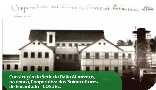
Construção da Sede da Dália Alimentos, na época, Cooperativa dos Suinocultores de Encantado - COSUEL.