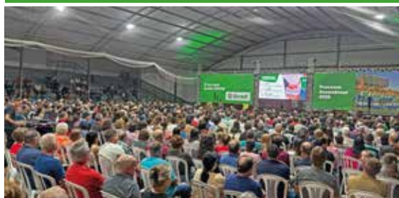
26/03 - CAPITÃO