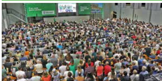
18/03 - GUAPORÉ