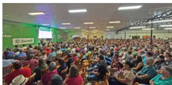
10/03 - PUTINGA