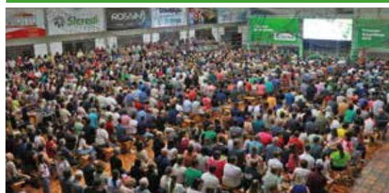
12/03 - ANTA GORDA