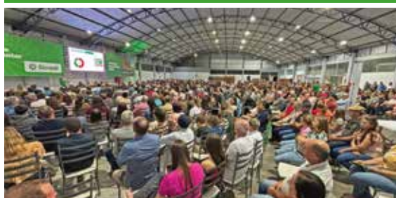
11/03 - ILÓPOLIS