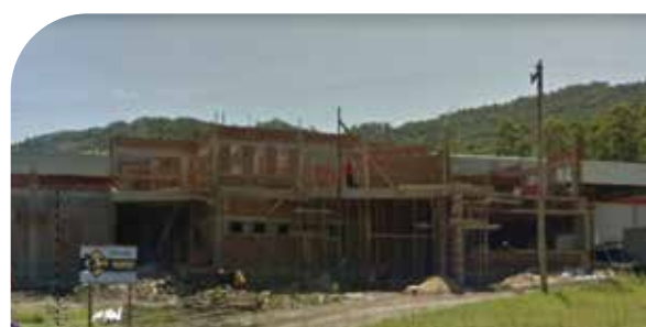
Construção do novo prédio administrativo e mudança para estrutura com 4.600 m 2 em 2017.