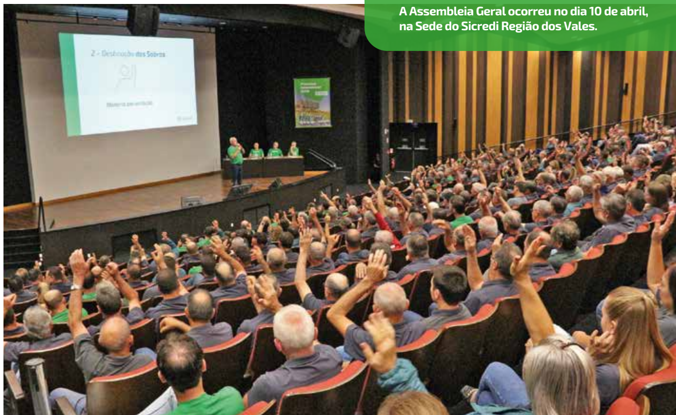
A Assembleia Geral ocorreu no dia 10 de abril, na Sede do Sicredi Região dos Vales.

A Assembleia Geral Ordinária foi realizada no dia 10 de abril, no Auditório da Sede do Sicredi Região dos Vales, em Encantado. Na ocasião, os delegados, que são representantes dos associados, deliberaram sobre a prestação de contas e a destinação das sobras.