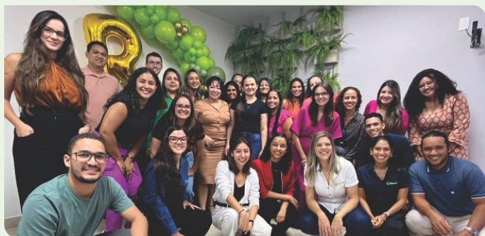
Equipe de Colaboradores - Pontos Focais

Realizadas anualmente pelas mais de 100 cooperativas que fazem parte do Sicredi, as assembleias possibilitam que os mais de 7 milhões de associados ao Sicredi participem de suas decisões, de forma democrática e transparente. Em 2023, foram mais de 1,4 mil encontros nos formatos digital, presencial e semipresencial, reunindo aproximadamente 700 mil pessoas.