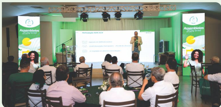
Assembleia Geral Ordinária e Extraordinária