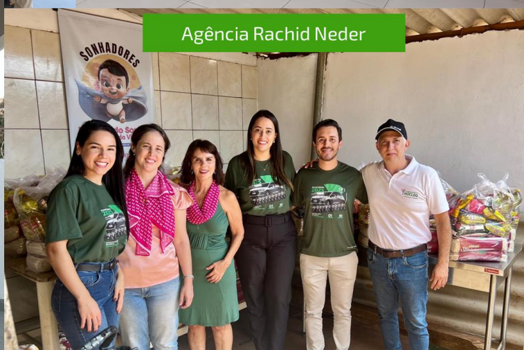
Agência Rachid Neder