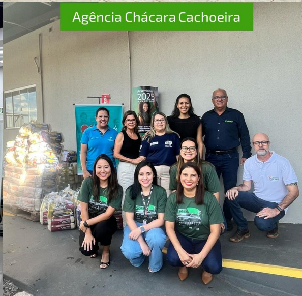
Agência Chácara Cachoeira