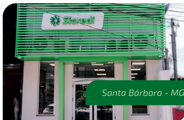
Santa Bárbara - MG

Essa expansão não é apenas uma estratégia de negócios, mas um reflexo do nosso propósito de fortalecer ainda mais o desenvolvimento local, garantindo que cada cidade e cada comunidade se beneficie das oportunidades de crescimento que estamos trazendo para essa região vibrante e de enorme potencial.