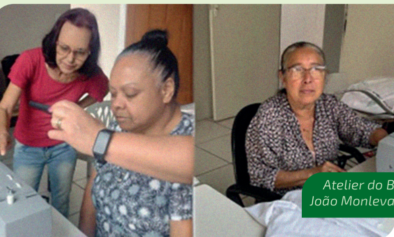
Atelier do Bem João Monlevade