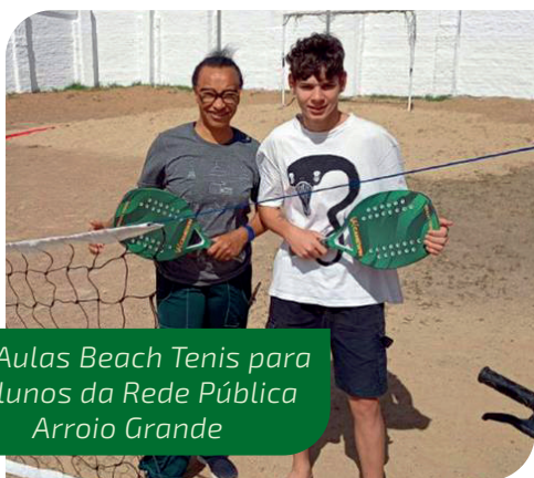
Aulas Beach Tennis para Alunos da Rede Pública Arroio Grande