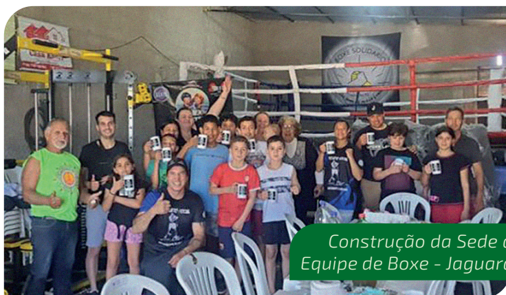
Construção da Sede da Equipe de Boxe - Jaguarão