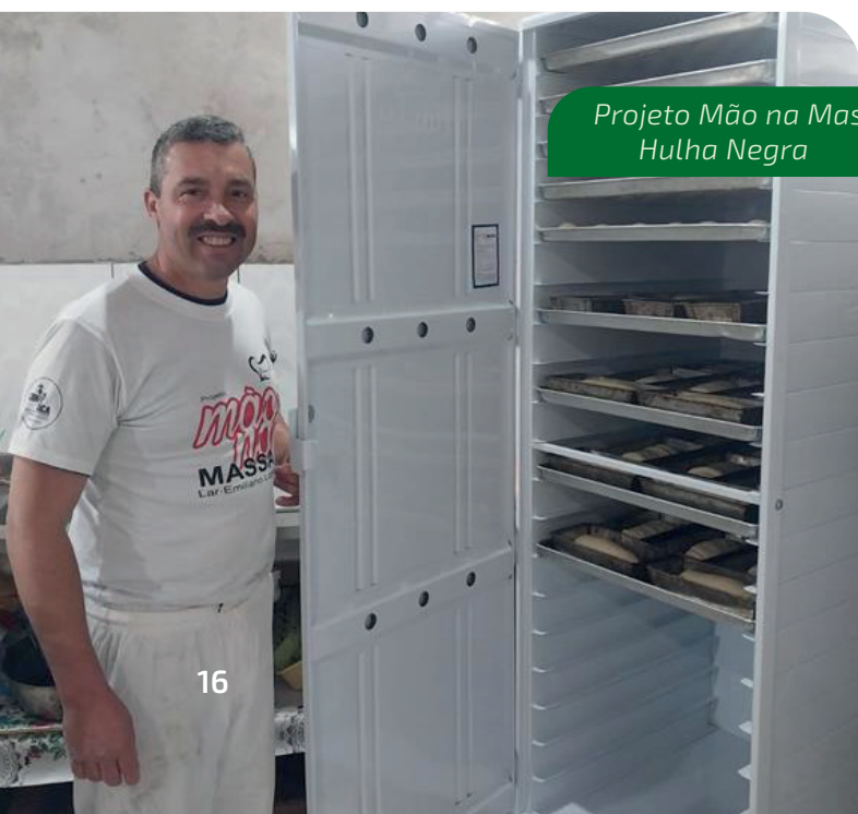
Projeto Mão na Massa Hulha Negra