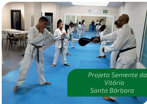
Projeto Semente da Vitória Santa Bárbara