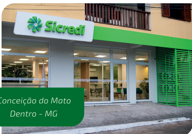
Conceição do Mato Dentro - MG

Na Sicredi Liberdade, temos o orgulho de estar presentes fisicamente em todos esses municípios, com agências abertas e prontas para atender aos cidadãos e empresas da região. Nosso compromisso vai além do simples