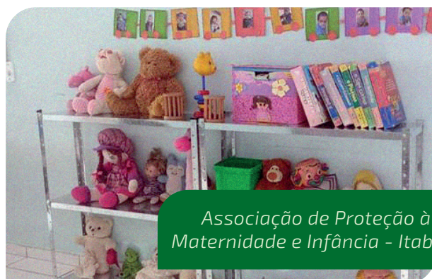
Associação de Proteção à Maternidade e Infância - Itabira