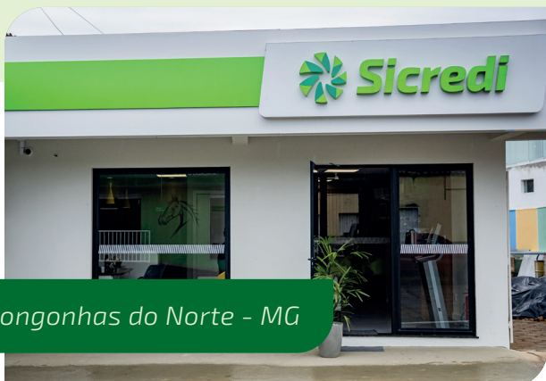
Congonhas do Norte - MG

Na Sicredi Liberdade, temos o orgulho de estar presentes fisicamente em todos esses municípios, com agências abertas e prontas para atender aos cidadãos e empresas da região. Nosso compromisso vai além do simples