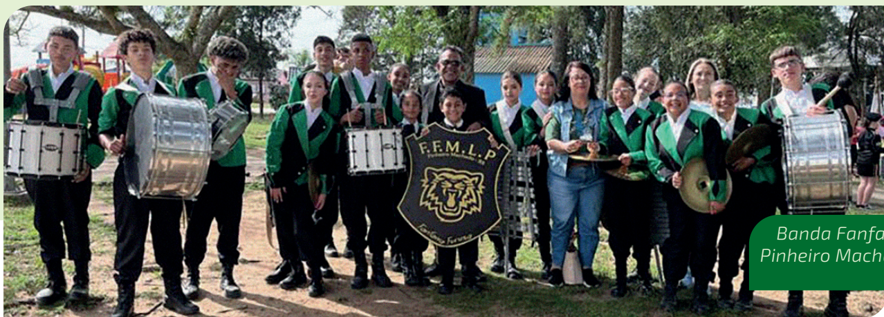
Banda Fanfarra Pinheiro Machado