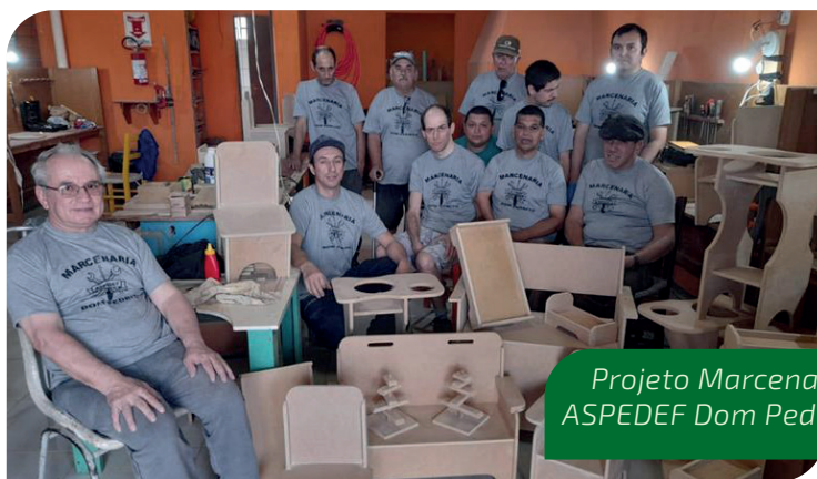
Projeto Marcenaria ASPEDEF Dom Pedrito