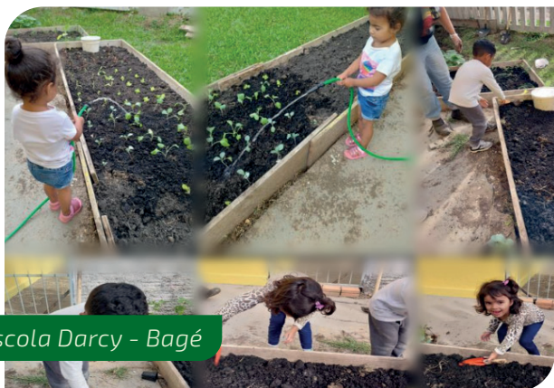
Escola Darcy - Bagé