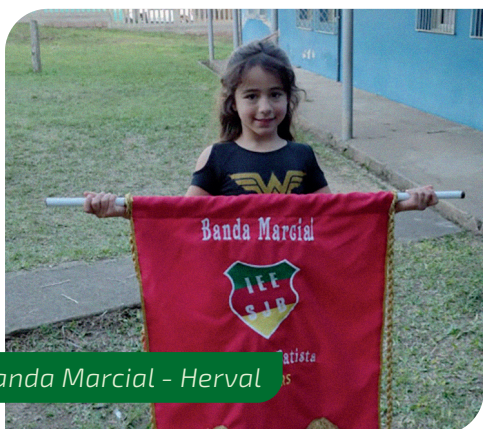
Banda Marcial - Herval