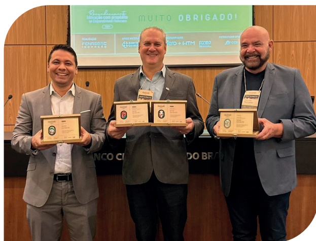
Lideranças recebem a premiação do RECIP em 2024

Na edição anterior da premiação, recebemos reconhecimento em três dimensões. O RECIP busca identificar a capacidade de inovação das cooperativas, conectada ao propósito e metas de desenvolvimento sustentável. Ao todo, após processo de avaliação, 25 cooperativas brasileiras foram elegíveis ao reconhecimento e nove foram agraciadas.