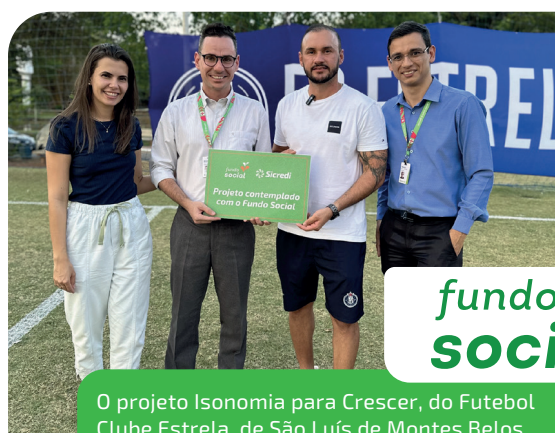
O projeto Isonomia para Crescer, do Futebol Clube Estrela, de São Luís de Montes Belos, está entre os contemplados

Fomentando a economia local e a inclusão financeira, buscamos compreender as necessidades dos associados, oferecendo soluções financeiras que geram renda e contribuem para a melhoria da qualidade de vida. Afinal, no cooperativismo, eles são os donos do negócio e o relacionamento próximo faz parte da nossa essência