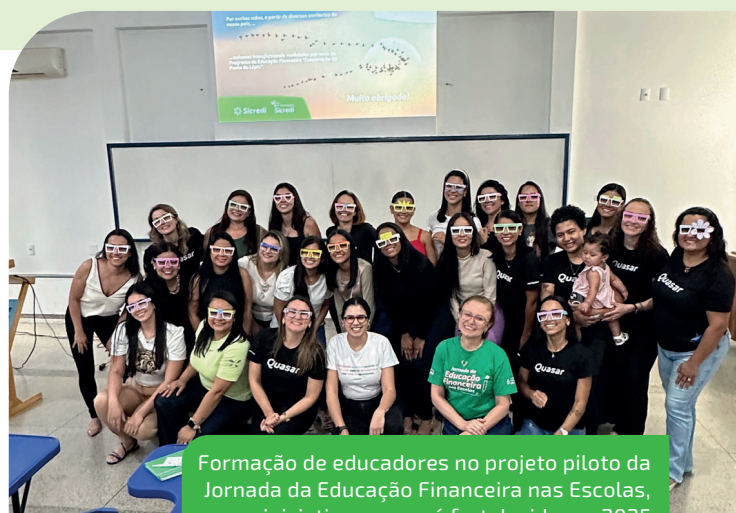
Formação de educadores no projeto piloto da Jornada da Educação Financeira nas Escolas, iniciativa que será fortalecida em 2025

Para contribuir com o desenvolvimento das comunidades, por meio do Fundo Social, apoiamos projetos de interesse coletivo voltados para educação, cultura, esporte, meio ambiente, segurança, inclusão social e demais temas que estejam alinhados com os princípios do cooperativismo. Na última edição, foram contemplados 34 projetos, em 13 cidades goianas, impactando mais de 40 mil pessoas.