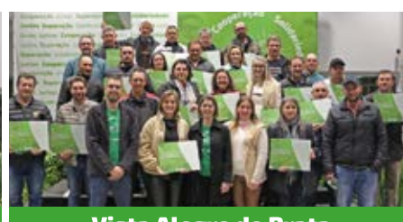
Vista Alegre do Prata