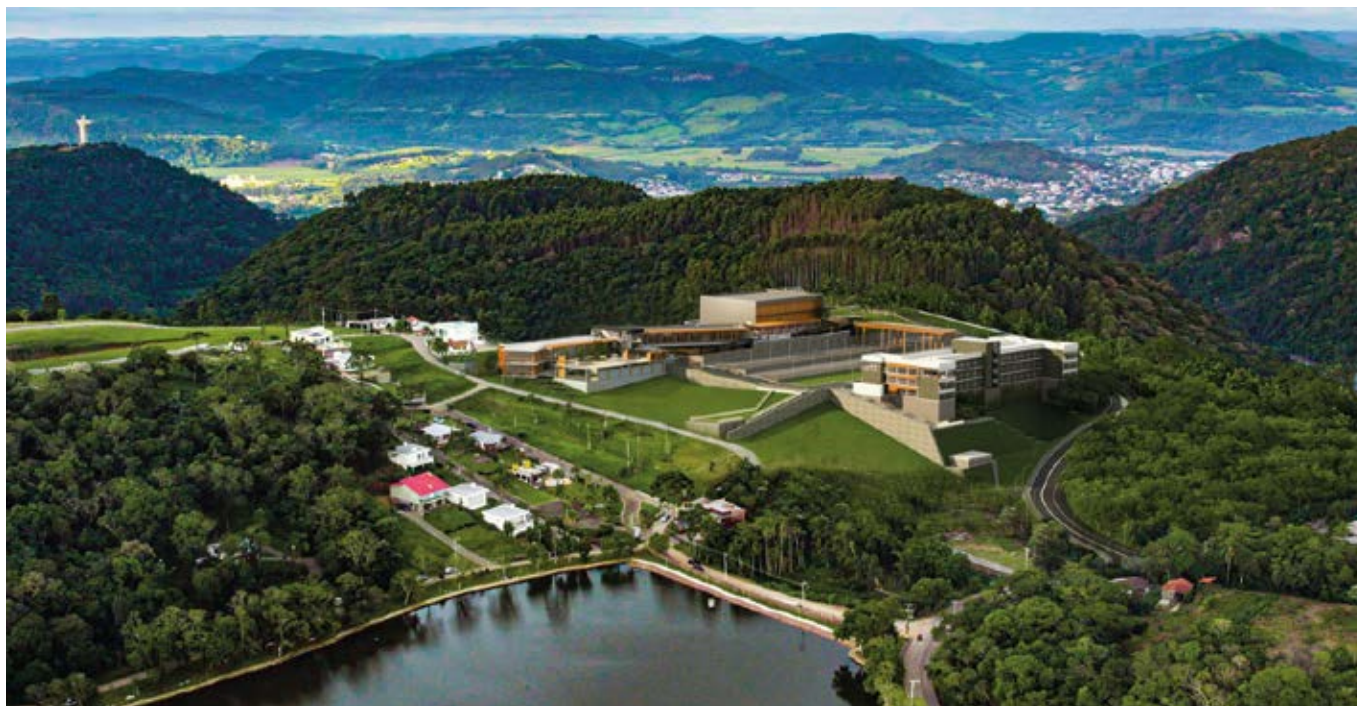
Projeto completo do Boulevard Encantado.

O Boulevard Encantado nasceu da visão de criar um espaço que integrasse lazer, cultura, gastronomia e sustentabilidade, capaz de transformar o Vale do Taquari em um destino turístico de destaque no Brasil. O projeto, inaugurado no dia 21 de novembro, foi idealizado para atender às necessidades do turismo moderno, oferecendo infraestrutura diferenciada e experiências inovadoras, além de valorizar o patrimônio natural e cultural da região.