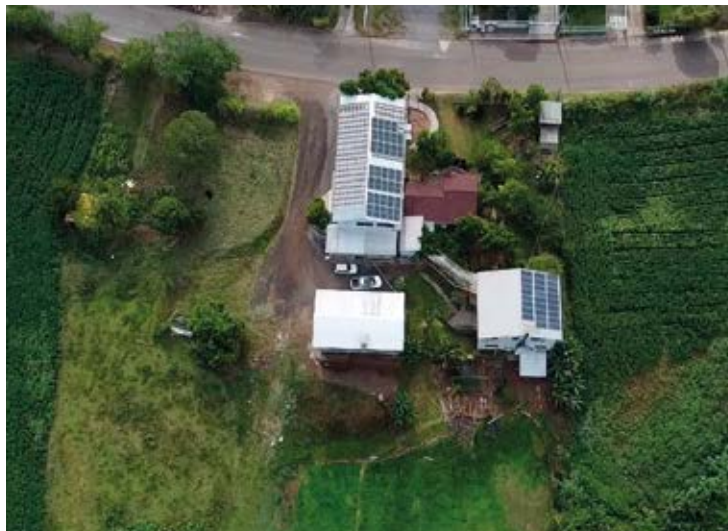
Espaço antes de ser atingido pelas cheias