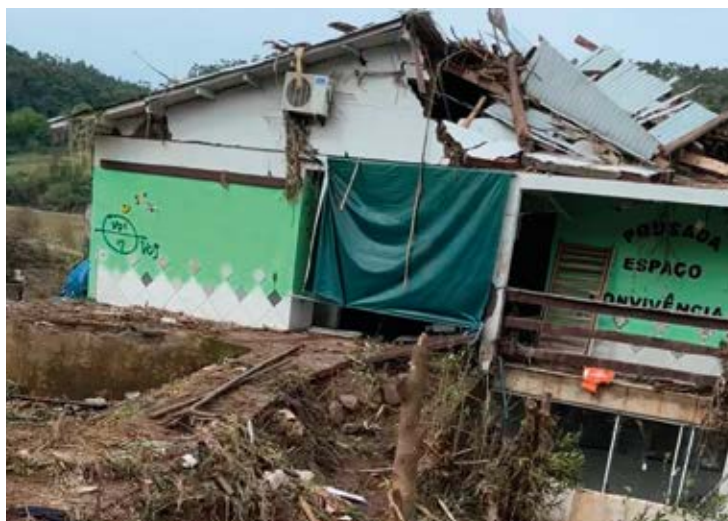
Perda estrutural ocorrida na enchente de maio