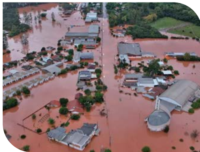
Comunidade Jacarezinho durante a enchente de maio

Em Encantado, entidades que atuam no bairro Jacarezinho também foram contempladas no Projeto Juntos pela Região, como a Comunidade Católica São Carlos, o Clube Serrano, a Associação Cultural e a Associação Mantenedora do Cemitério São Carlos, contribuindo para que os locais pudessem novamente ser utilizados pelos moradores e que as atividades da comunidade voltassem a ser realizadas.