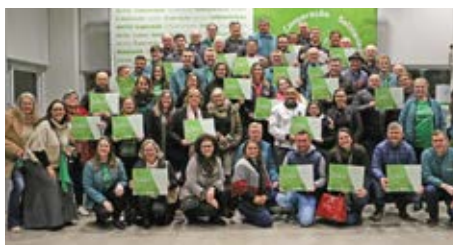
Arroio do Meio