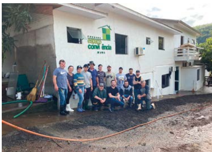
Voluntários e familiares atuando na reconstrução do local