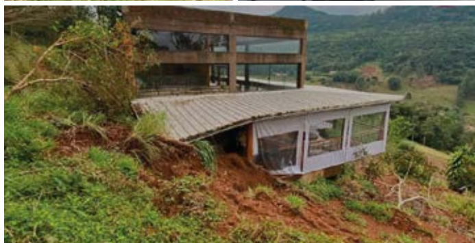
O Aloha Espaço Natural antes e depois de ser atingido pelos deslizamentos, em maio. Com o apoio da comunidade, a família prevê a reabertura do espaço em breve.