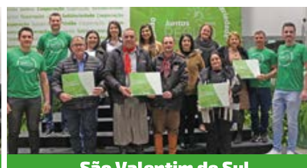
São Valentim do Sul