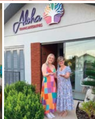
O Aloha Terapias Integrativas ficou completamente submerso durante enchente de maio. O espaço já está recebendo clientes após limpeza e reconstrução.