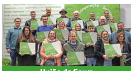
União da Serra