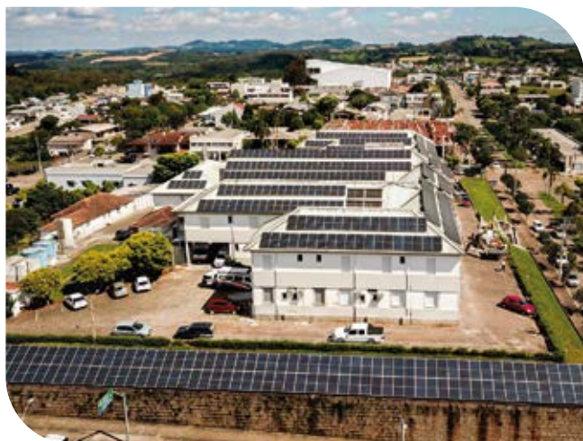
Hospital Manoel Francisco Guerreiro, de Guaporé

Sobre a importância do trabalho voluntário, enfatiza ser um ato de zelo para com as outras pessoas. “O voluntariado vai além de doar tempo. É uma verdadeira expressão de amor e cuidado com o próximo. Com a colaboração de todos, conseguimos transformar realidades e oferecer um atendimento ainda mais humanizado.”