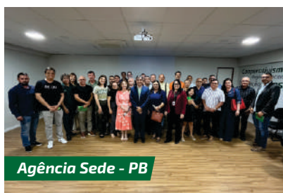
Agência Sede - PB

O Programa Crescer é permanente na cooperativa e os associados interessados em participar podem procurar suas agências ou realizá-lo na modalidade remota através da nossa Plataforma de Cursos no endereço http://sicredi.com.br/nacomunidade/cursos .