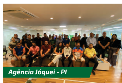
Agência Jóquei - PI