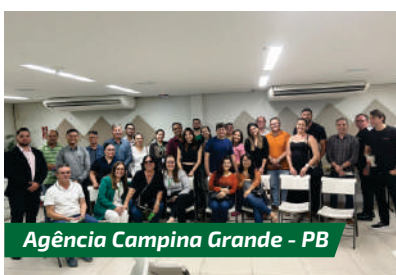
Agência Campina Grande - PB