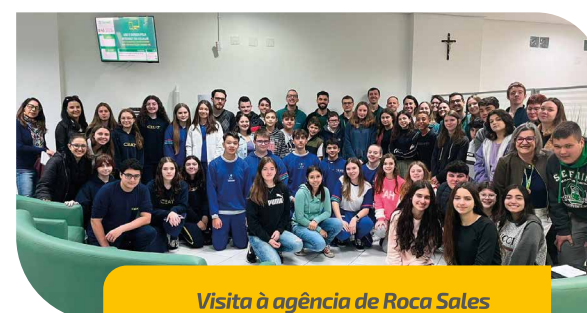
Visita à agência de Roca Sales