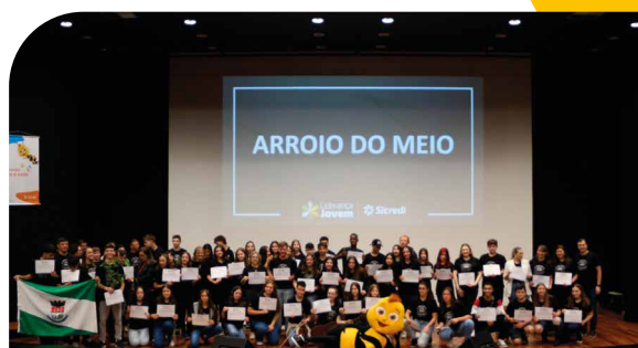
Líderes de turma do município de Arroio do Meio