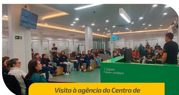
Visita à agência do Centro de Arroio do Meio