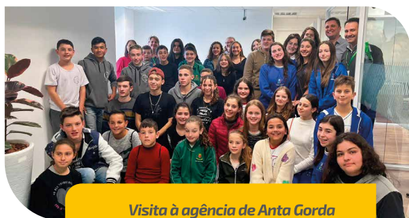
Visita à agência de Anta Gorda