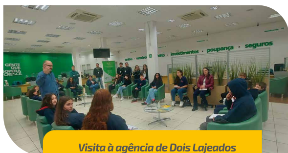
Visita à agência de Dois Lajeados