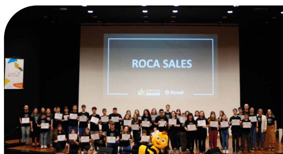
Líderes de turma do município de Roca Sales