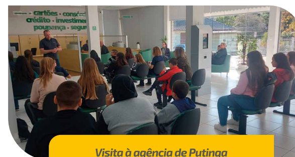
Visita à agência de Putinga