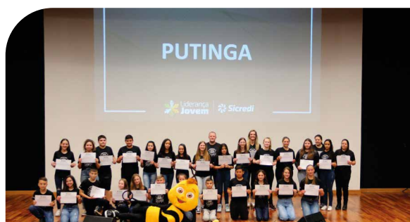
Líderes de turma do município de Putinga