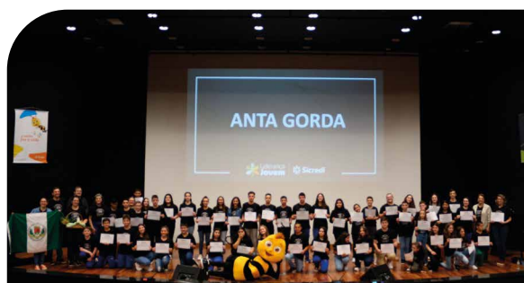
Líderes de turma do município de Anta Gorda