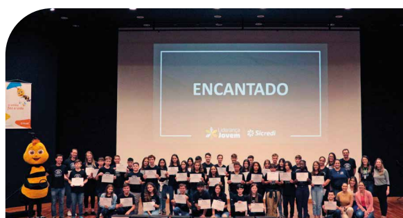
Líderes de turma do município de Encantado