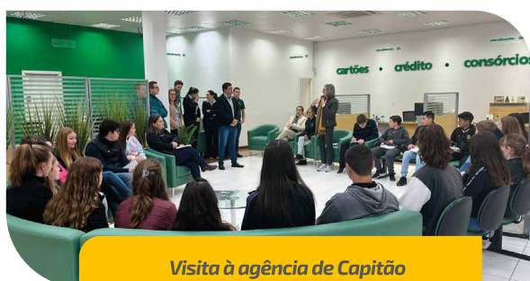
Visita à agência de Capitão