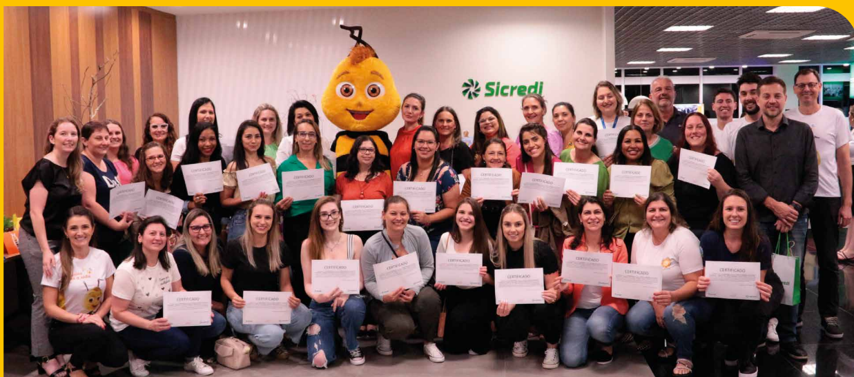
Educadores e representantes do município de Encantado