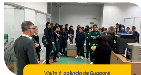
Visita à agência de Guaporé