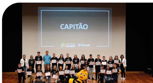
Líderes de turma do município de Capitão