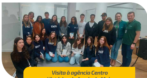
Visita à agência Centro Histórico de Arroio do Meio