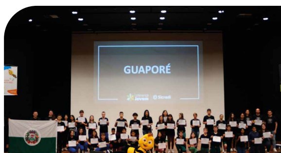
Líderes de turma do município de Guaporé