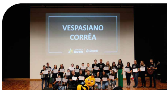
Líderes de turma do município de Vespasiano Corrêa

Alunos dos nove municípios participantes do Projeto em 2023.