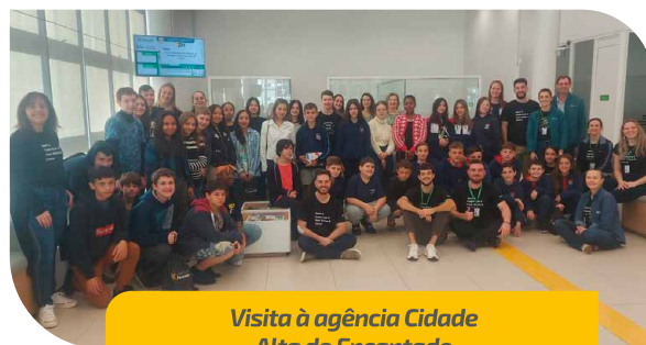
Visita à agência Cidade Alta de Encantado