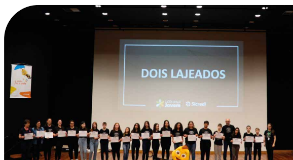
Líderes de turma do município de Dois Lajeados