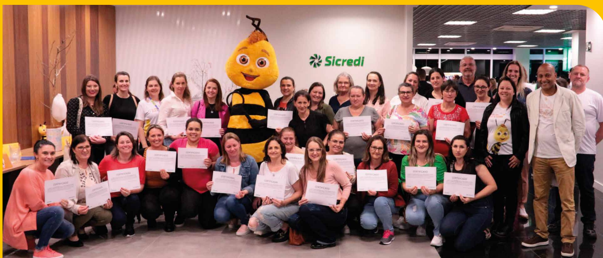
Educadores e representantes do município de Putinga