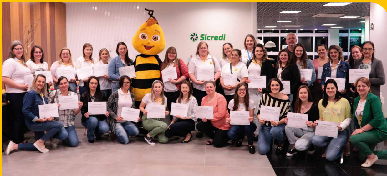
Educadores e representantes do município de Anta Gorda