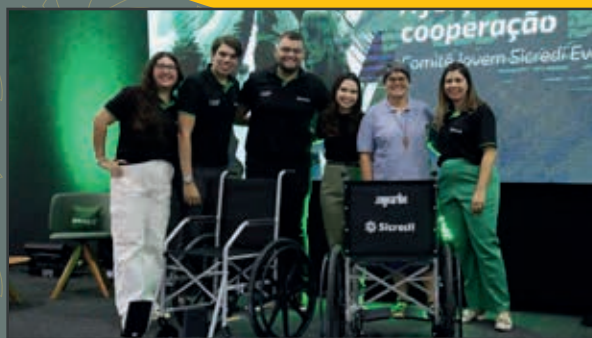
Doação de cadeiras de rodas para instituições sociais da grande João Pessoa