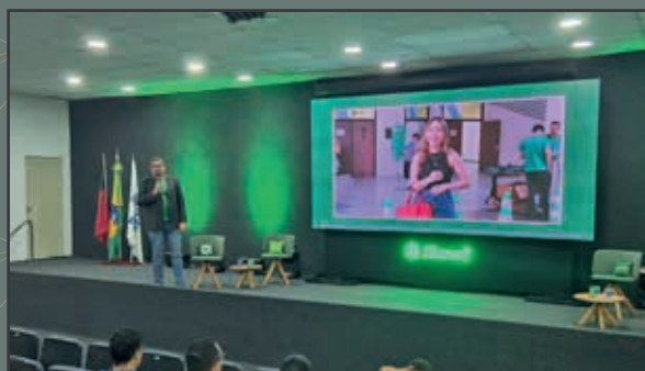
Momento do programa Cooperação na Ponta do Lápis com educação financeira