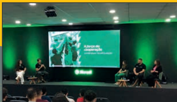
Bate-papo "A força da cooperação" com os integrantes do Comitê Jovem Evolução