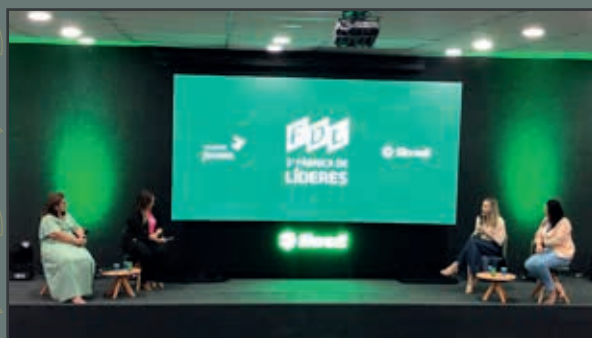
Bate-papo com especialistas sobre os "Desafios do Mercado de Trabalho"