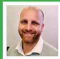
Luiz Augusto Elsele Agência Centro