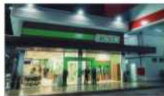
Agência Jaraguá - Água Verde