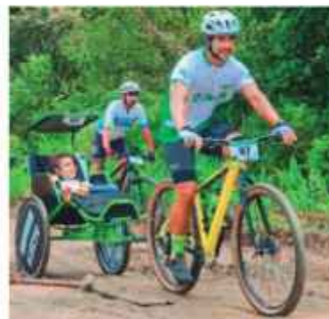
MTB São Chico

“O Sicredi não apenas ajudou a sustentar um projeto, mas construiu pontes de esperança e possibilitou sonhos. Juntos, estamos transformando vidas de crianças e jovens com câncer, suas famílias e fazendo a diferença”.