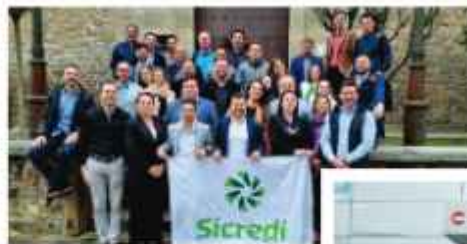
Grupo do Sicredi Norte SC na Universidade de Mondragon.

Em outubro um grupo de colaboradores realizou uma imersão sobre cooperativismo na Europa (Espanha/Suíça). Um dos destaques foram as aulas sobre cooperativismo na Universidade de Mondragon. O sistema Mondragon é uma federação de cooperativas oriunda do País Basco, na Espanha, fundada pelo padre José María Arizmendiarieta em 1956. Atualmente é composta por 256 empresas e entidades distribuídas em quatro áreas: finanças, indústria, distribuição e conhecimento.