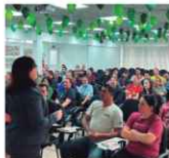
Semana SIPAT na empresa Oxford.

As ações de Educação Financeira estreitaram os laços de parcerias com as empresas associadas levando conhecimento, conscientização e alternativas para realização de sonhos dos seus funcionários.