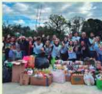
Comunidade Quilombola, em Joinville/SC.

Durante o "Dia C", Dia de Cooperar, os colaboradores preparam ações sociais nas comunidades. Neste ano, 28 ações impactaram 800 pessoas com arrecadação de alimentos e itens de higiene e limpeza, hortas comunitárias, visitas à Lar de Idosos e entrega de sopão.