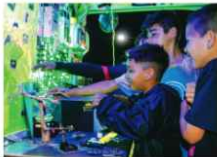
Cinesolarzinho em Barra Velha/SC.