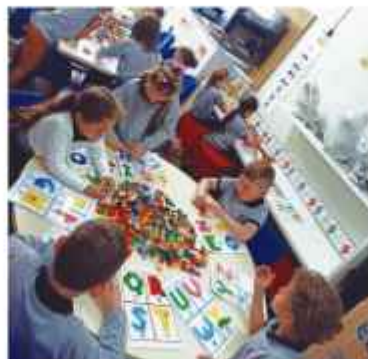
Escola Professora Isabel Silveira Machado