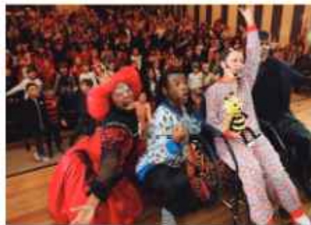
Teatro Zum Zum Zum em Joinville/SC.

Em junho de 2023, com apoio da Fundação Sicredi, recebemos a peça teatral ZUM ZUM ZUM, que trouxe valores da cooperação, solidariedade e o respeito ao próximo para mais de 400 alunos. As crianças de 7 a 10 anos prestigiaram este espetáculo de turnê nacional, por meio da Lei Federal de Incentivo à Cultura, no Teatro da UniSociesc em Joinville. Em outubro recebemos em Barra Velha, um cinema itinerante movido a energia solar, o Cinesolarzinho e Cine Sustentável. Além de assistir uma sessão com vários curtas-metragens, as crianças da EBM Professora Antonia Gasino de Freitas, visitaram o furgão equipado com placas solares e sistema conversor de energia.