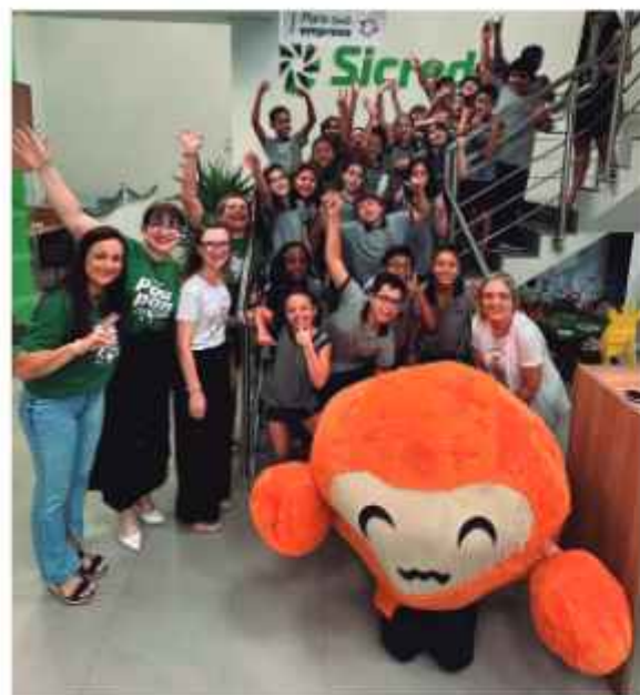
Alunos da Escola Anita Garibaldi na Agência Getúlio Vargas.

O programa Cooperação na Ponta do Lápis conscientiza os participantes para tomada de decisões econômicas e financeiras que impulsionam o seu crescimento e da comunidade. Em 2023, promovemos mais de 160 ações de Educação Financeira. Com as crianças, o destaque foi o "Projeto Piloto de Educação Financeira" na Escola Anita Garibaldi, em Joinville, e na Escola Alto São Luís Alves, em Massaranduba. Através do projeto as crianças aprendem de forma divertida, com gibis, vídeos e jogos da Turma da Mônica.