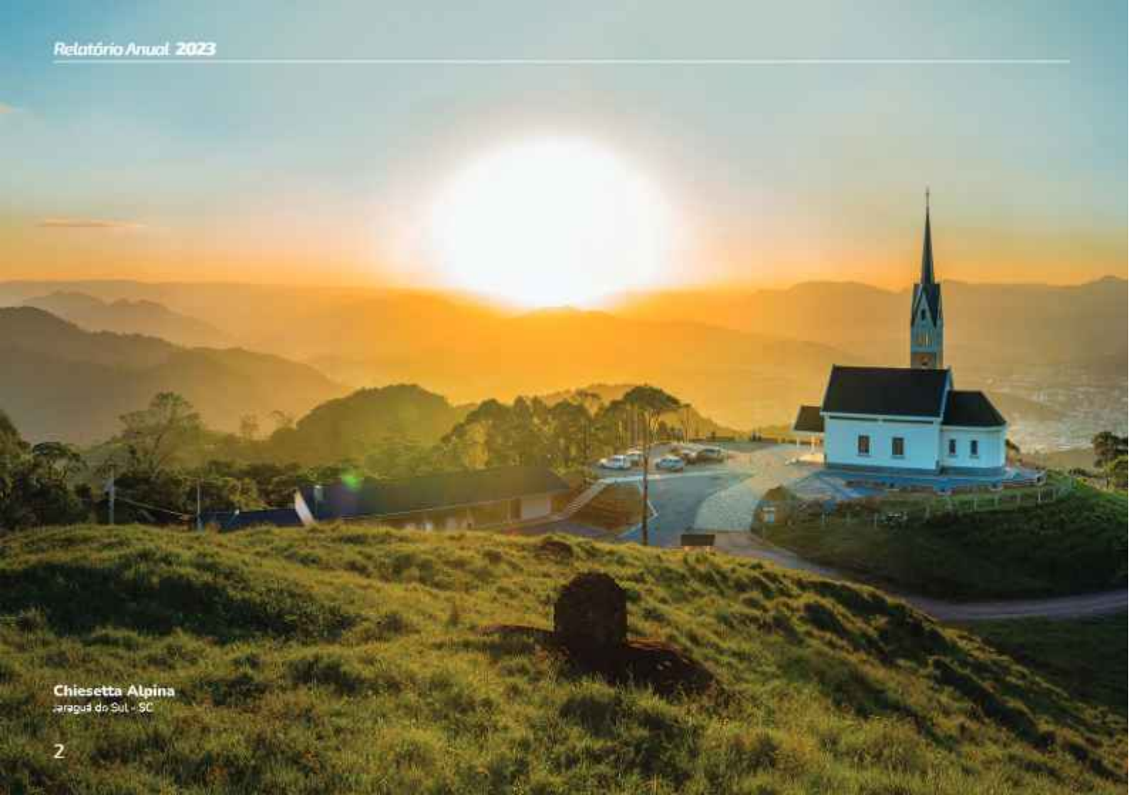
Chiesetta Alpina Jaraguá do Sul - SC