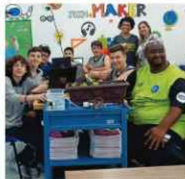
Escola Plácido Xavier Vieira