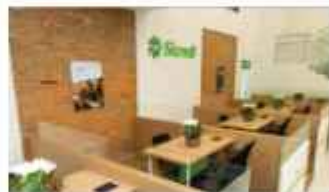
Agência Campo Alegre