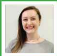
Mayla K. Dallabona Agência Centro