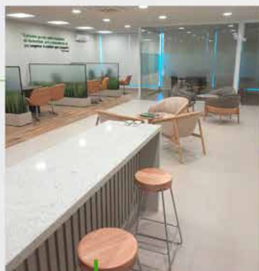
Reinauguração Foz Morumbi