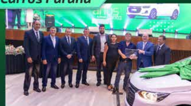
Chevrolet Onix LS Agência Rio do Salto Alexandre Klein