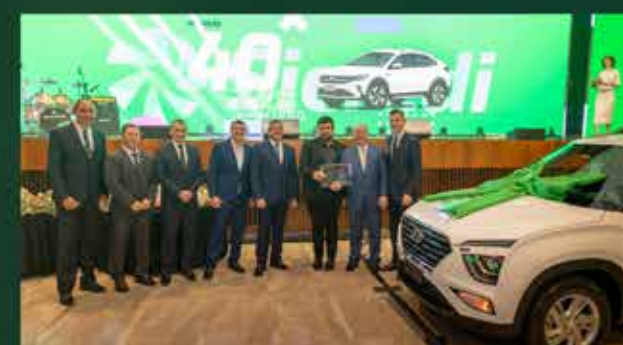
Hyundai Creta