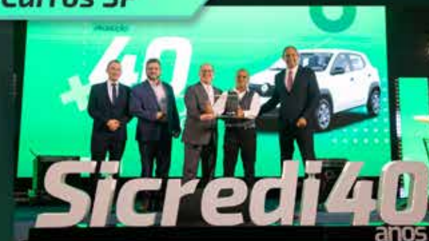
Renault Kwid Zen - Agência Guarulhos/SP Elisantos Materiais Elétricos e Para Construção LTDA