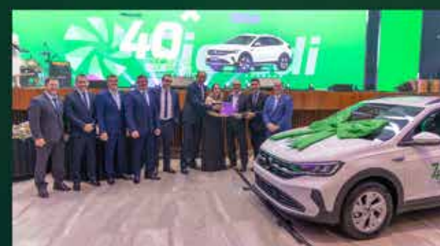
Volkswagen Nivus Comfortline Agência Agrocafeeira D E D Logística E Transporte Ltda