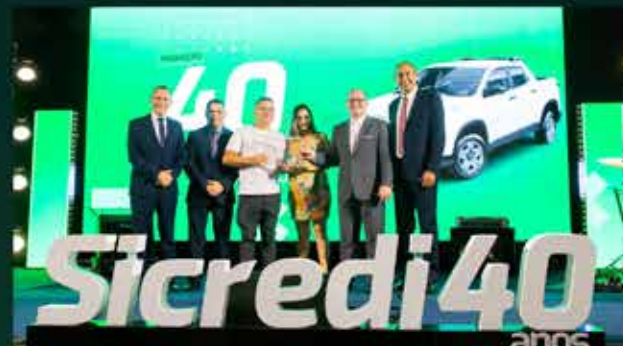
Fiat modelo Toro Endurance Agência São José dos Campos/SP E R Caires