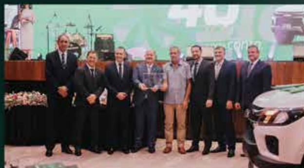
Chevrolet S-10 LT Agência Catanduvas Vitorio De Souza