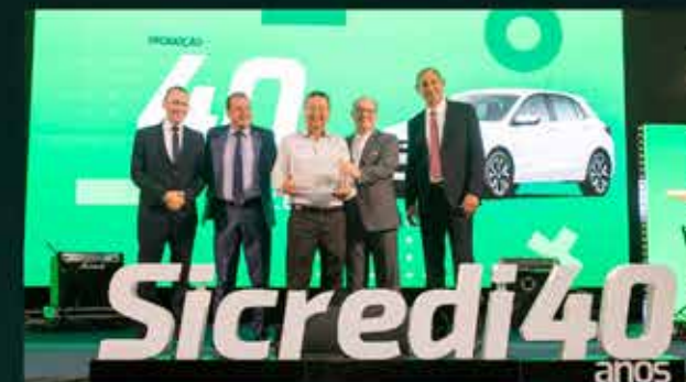
Chevrolet Onix LS Agência Taubaté/SP Eduardo Kiyohara