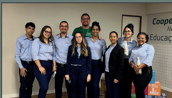
Oficina Apontando o Lápis Central de Relacionamento - João Pessoa