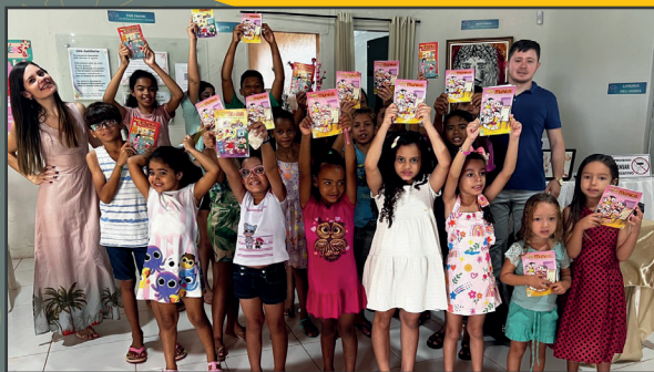
Cinema da Turma da Mônica Picos/PI