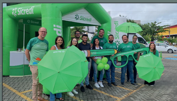
Pit Stop da Educação Financeira Campina Grande/PB