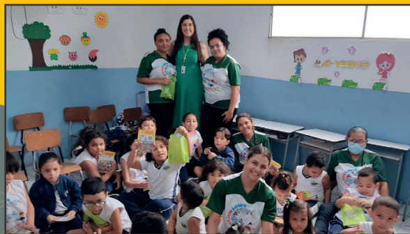
Cinema da Turma da Mônica Parnaíba/PI