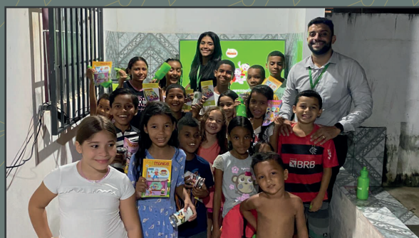
Cinema da Turma da Mônica Teresina/PI