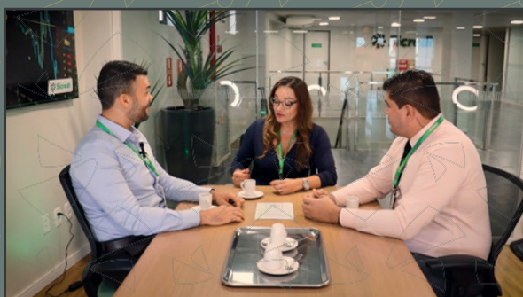
Café com Finanças