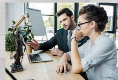
Extensão dos serviços aos profissionais e servidores da área jurídica.