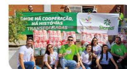
MOSSORÓ – Instituto Amantino Câmara