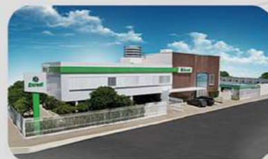
Ampliação e reforma da sede em Natal.