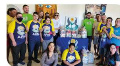
PAU DOS FERROS – APAE (Associação de Pais e Amigos dos Excepcionais)

Além disso, cerca de meia tonelada de cestas básicas foram distribuídas para a APAE (Associação de Pais e Amigos dos Excepcionais), em Pau dos Ferros, que atende jovens e crianças com deficiências, como também para abrigos de idosos. Nestes, ainda foram entregues em torno de 7 mil fraldas geriátricas a mais de 350 residentes. Tudo isso somado às doações arrecadadas com os associados de cada agência, no sorteio do balaio junino.