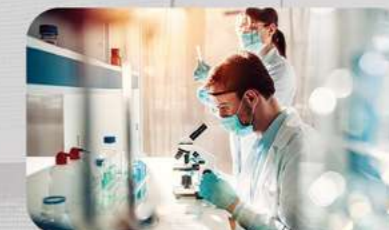
Expandimos novamente: inclusão dos profissionais de nível superior de Ciências e Artes.