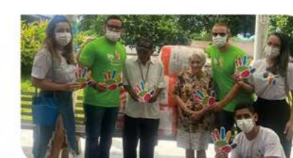
PARNAMIRIM – LEAN (Lar Espírita Alvorada Nova)