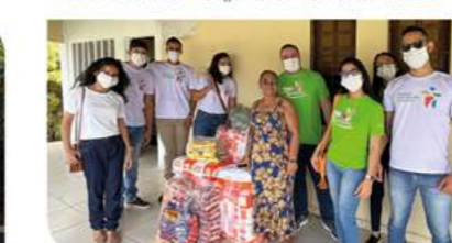
SÃO GONÇALO DO AMARANTE – Lar Madre Tereza de Calcutá