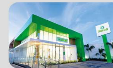
1ª cooperativa de referência estadual do Sistema Sicredi.