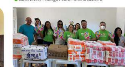
CAICÓ – Abrigo Dispensário Professor Pedro Gurgel