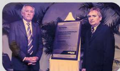
Inauguração da sede própria (Natal/RN)