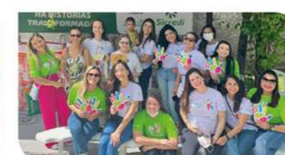
NATAL – Lar da Vovozinha