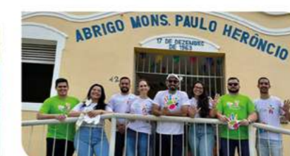
CURRAIS NOVOS – Abrigo Monsenhor Paulo Heróncio