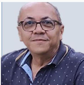
Air Cícero Cansação