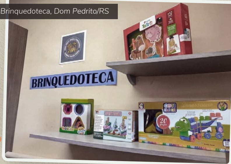
Brinquedoteca, Dom Pedrito/RS