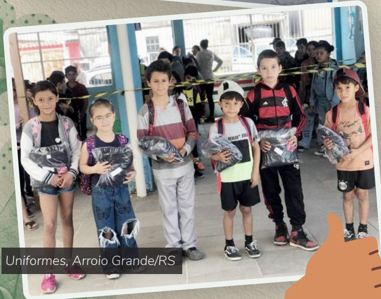
Uniformes, Arroio Grande/RS