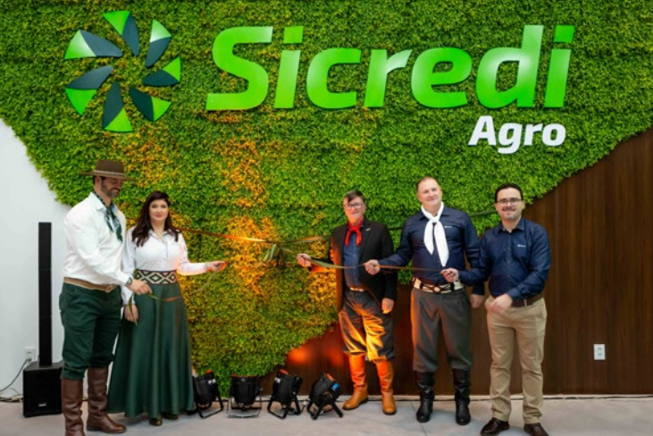
Fotos da noite de inauguração do espaço agro, em Bagé/RS