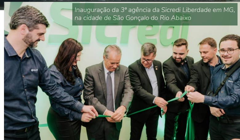
Inauguração da 3ª agência da Sicredi Liberdade em MG, na cidade de São Gonçalo do Rio Abaixo