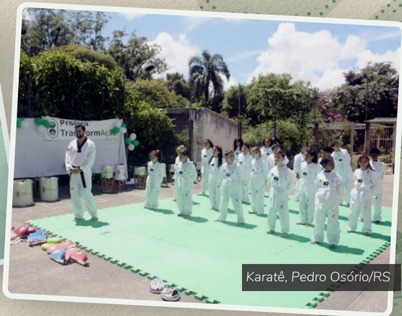
Karatê, Pedro Osório/RS