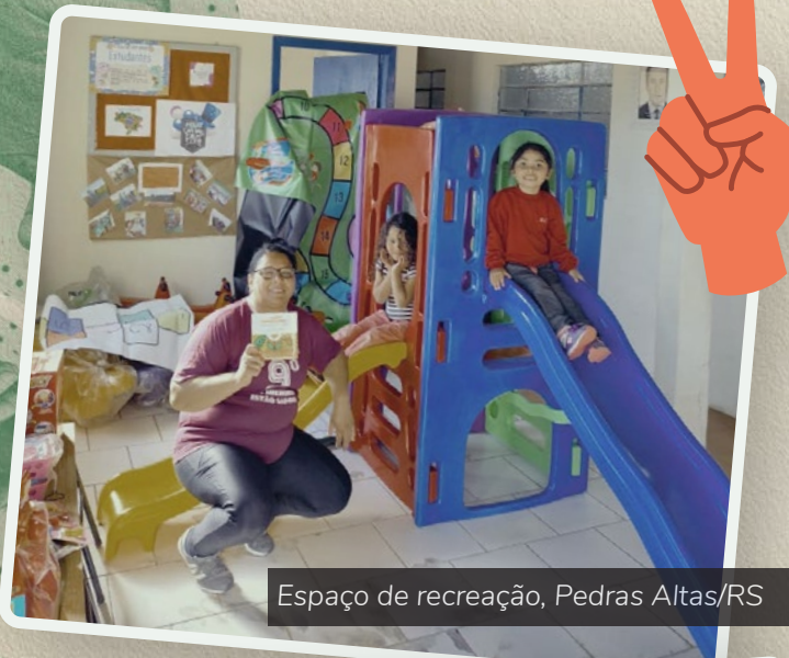
Espaço de recreação, Pedras Altas/RS

Em 2023, 130 projetos foram contemplados, sendo investidos mais de R$ 720 mil. Para este ano de 2024, o valor a ser destinado ultrapassa os R$ 798 mil.