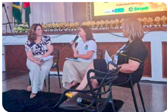
Mostra pedagógica em Dracena/SP

Em novembro e dezembro, tivemos nossas Mostras Pedagógicas nas cidades de Dracena, Inúbia Paulista, Herculândia e Pompeia, e nos colégios da Sagrado – Rede de Educação de Bauru e Marília. Esses eventos são organizados pelas Secretarias de Educação dos municípios e pelos colégios da rede privada, para que possam compartilhar com a comunidade e com os demais professores os mais de 300 projetos desenvolvidos durante o ano por meio da metodologia do Programa A União Faz A Vida.