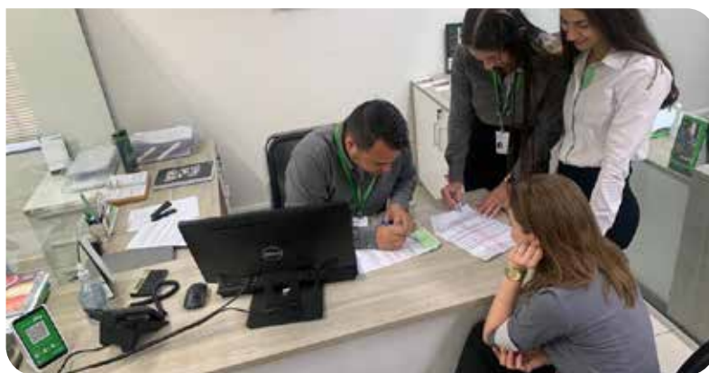
Assembleia da agência Dracena