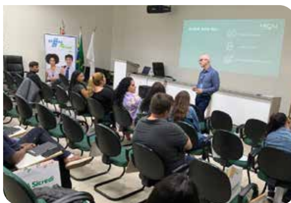
Turmas do JuntoSSS 2023 - Garça