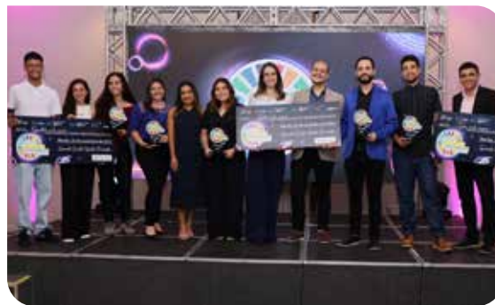
Ganhadores do PJI 2023

Criado pela equipe SUSStentaDente, do campus Bauru da Universidade de São Paulo (USP), o enxaguante bucal de baixo custo e sustentável conquistou a primeira posição do Prêmio Jovens Inovadores Sicredi 2023. O produto visa auxiliar a população de