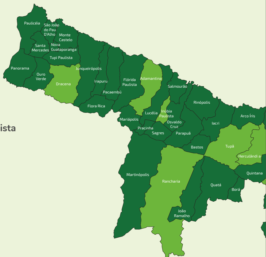
Mapa de atuação da Sicredi Centro Oeste Paulista

Fazemos parte do sistema Sicredi, a primeira instituição financeira cooperativa do Brasil com mais de 120 anos de existência. Atualmente, conta com mais de 7,5 milhões de associados e 2,7 mil agências instaladas pelos 26 estados do País e Distrito Federal.