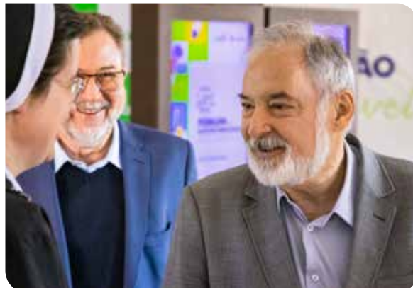
Lançamento do PUFV na Sagrado - Rede de Educação