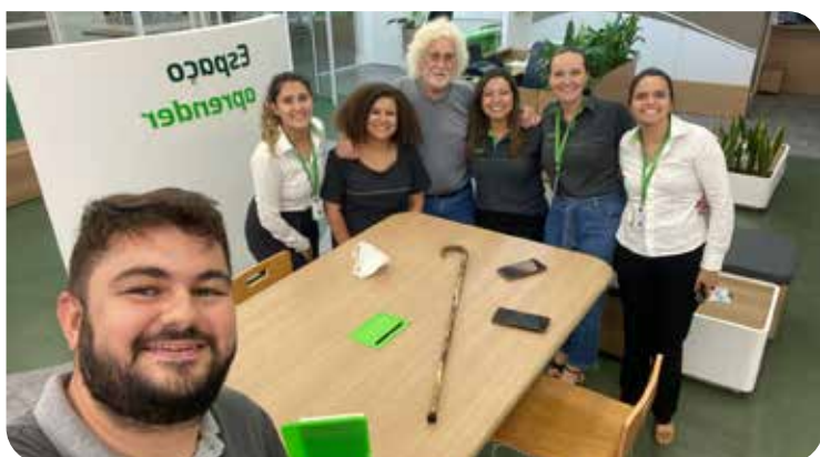
Assembleia da agência Pompeia