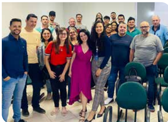
Turmas do JuntoSSS 2023 - Bauru e Agudos

O programa, realizado em parceria com o SEBRAE e o SESCOOP/SP, visa à capacitação profissional de pequenos empreendedores, desenvolvendo o conhecimento em negócios, marketing, administração e finanças. Desta forma, alavancamos os empreendimentos de 400 associados e, consequentemente, suas comunidades.