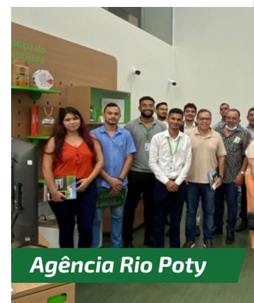
Agência Rio Poty