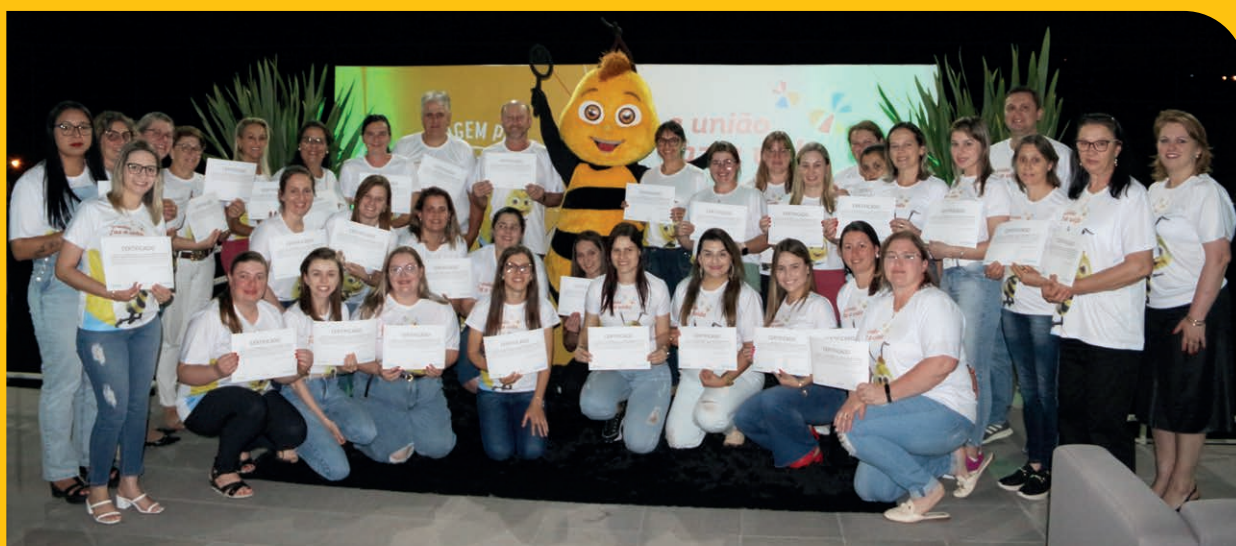
Educadores do município de Anta Gorda durante entrega de certificados da formação 2022