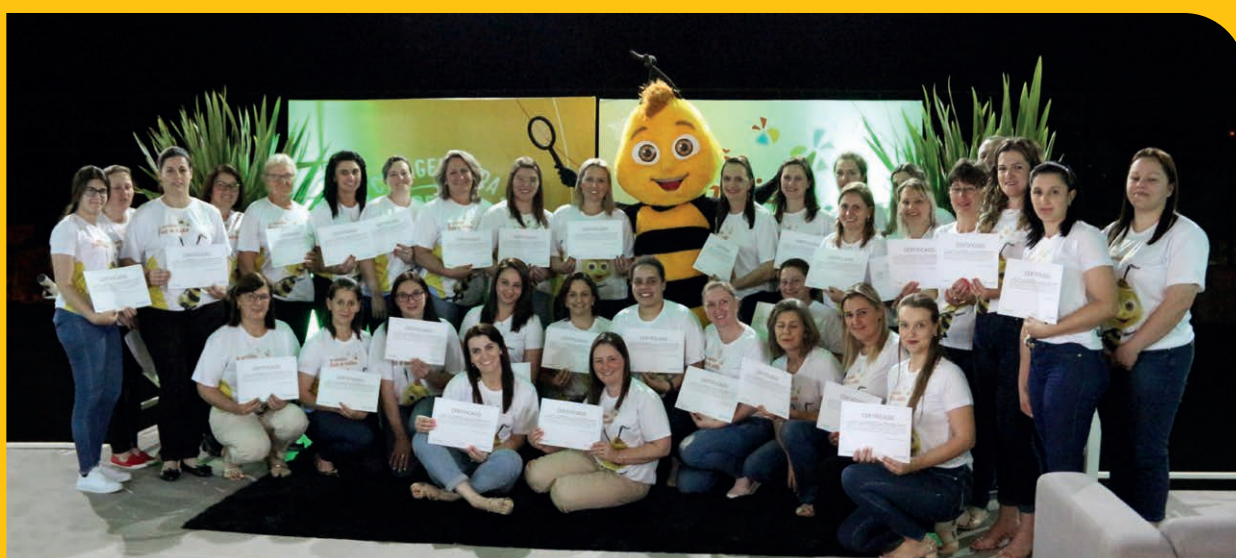
Educadores do município de Putinga durante entrega de certificados da formação 2022