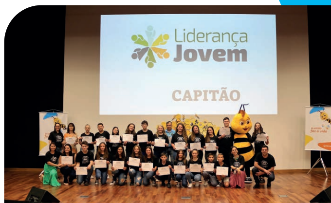
Alunos do município de Capitão durante entrega de certificados do Liderança Jovem 2022