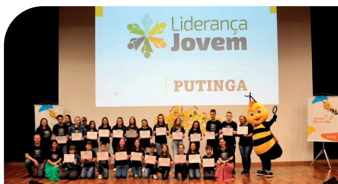
Alunos do município de Putinga durante entrega de certificados do Liderança Jovem 2022