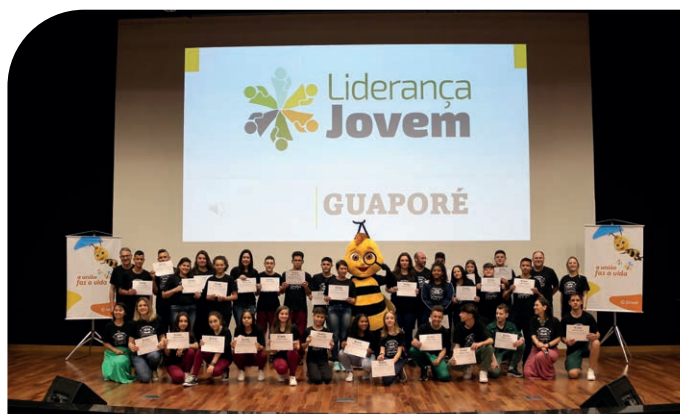
Alunos do município de Guaporé durante entrega de certificados do Liderança Jovem 2022