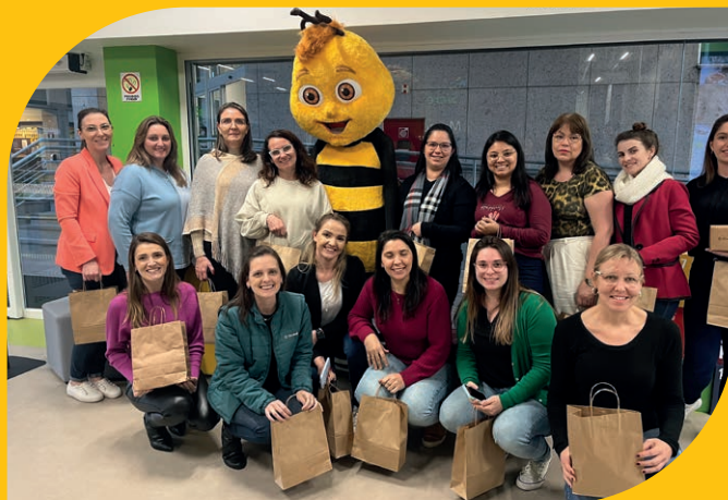
Educadores durante visita guiada à estrutura do Centro Administrativo Sicredi (CAS) e da Fundação Sicredi, localizadas em Porto Alegre.