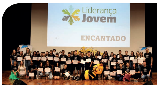
Alunos do município de Encantado durante entrega de certificados do Liderança Jovem 2022