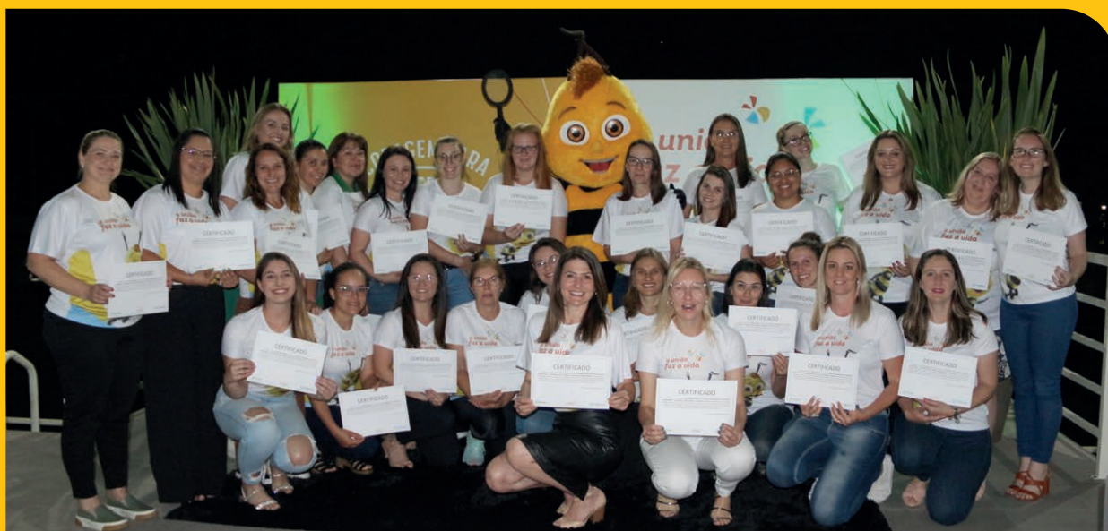
Educadores do município de Encantado durante entrega de certificados da formação 2022