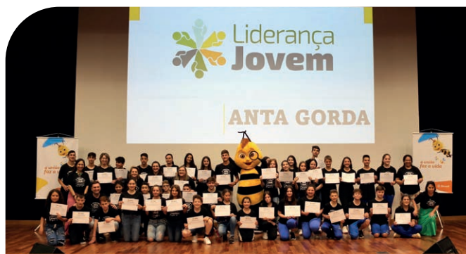
Alunos do município de Anta Gorda durante entrega de certificados do Liderança Jovem 2022