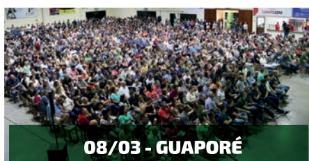
08/03 - GUAPORÉ