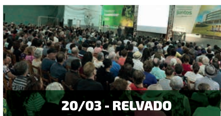
20/03 - RELVADO