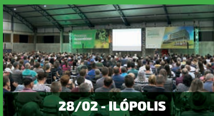
28/02 - ILÓPOLIS