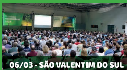
06/03 - SÃO VALENTIM DO SUL