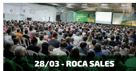
28/03 - ROCA SALES