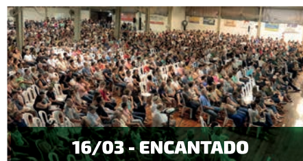
16/03 - ENCANTADO