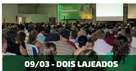
09/03 - DOIS LAJEADOS