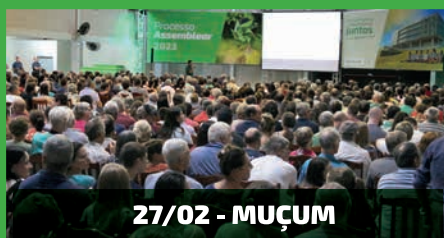
27/02 - MUÇUM

Cerca de 16 mil pessoas participaram do processo assemblear realizado de 27 de fevereiro a 28 de março