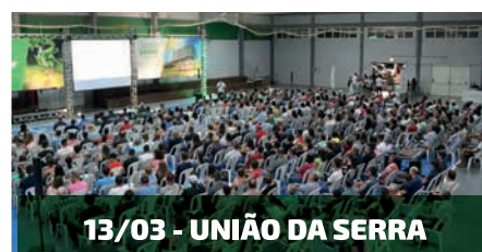
13/03 - UNIÃO DA SERRA