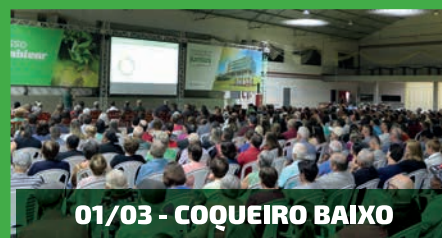
01/03 - COQUEIRO BAIXO