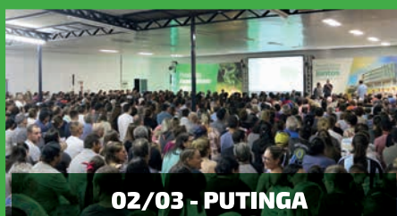
02/03 - PUTINGA