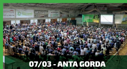
07/03 - ANTA GORDA