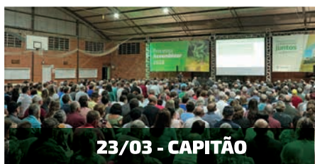
23/03 - CAPITÃO