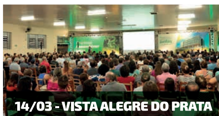
14/03 - VISTA ALEGRE DO PRATA