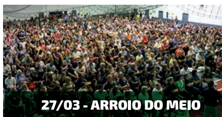
27/03 - ARROIO DO MEIO