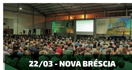
22/03 - NOVA BRÉSCIA