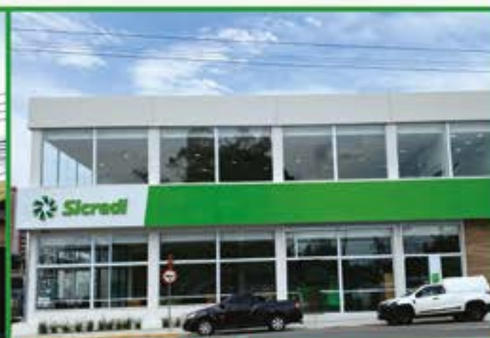
Jacarei - Nove de Julho