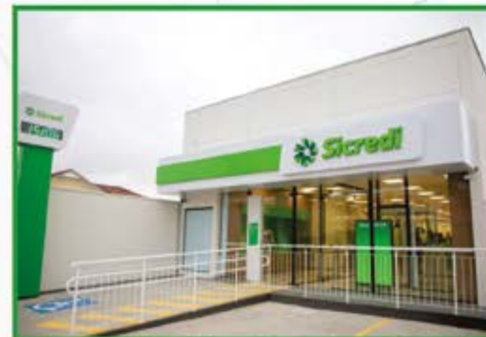
Pedregulho - Guaratingueta