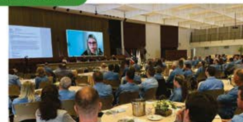
A AGO contou com um encontro presencial em Medianeira-PR, Aparecida-SP e com a participação de alguns delegados e da auditoria externa de maneira on-line