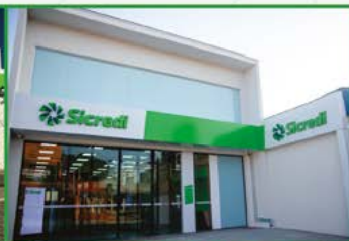
Independência - Taubaté