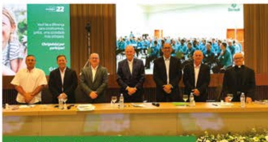
Mesa de honra da Assembleia Geral Ordinária da Sicredi Vanguarda PR/SP/RJ

A assembleia Geral Ordinária da Sicredi Vanguarda PR/SP/RJ aconteceu no dia 02 de abril, de maneira semipresencial. Os delegados da cooperativa e demais convidados foram divididos em regiões, uma parte se reuniu no Lar Centro de Eventos, em Medianeira – PR e de lá, foi transmitida a reunião simultaneamente para o Hotel Rainha do Brasil, em Aparecida – SP, através da Ferramenta Pertencer, que também pode ser acompanhado pelos coordenadores que optaram em assistir on-line.