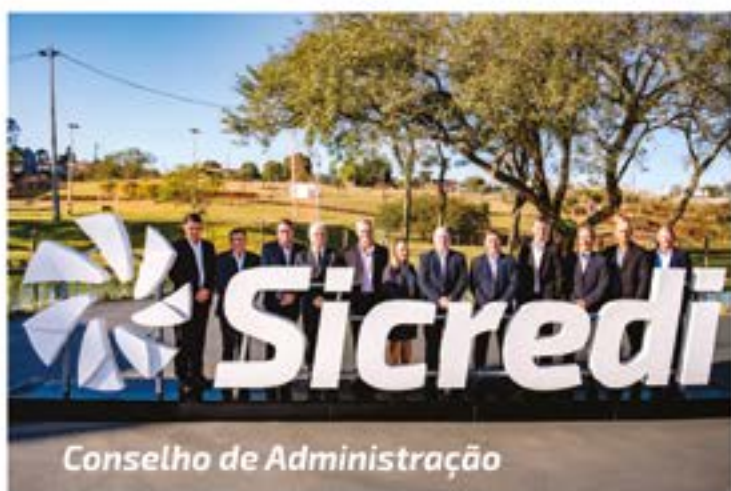
Conselho de Administração