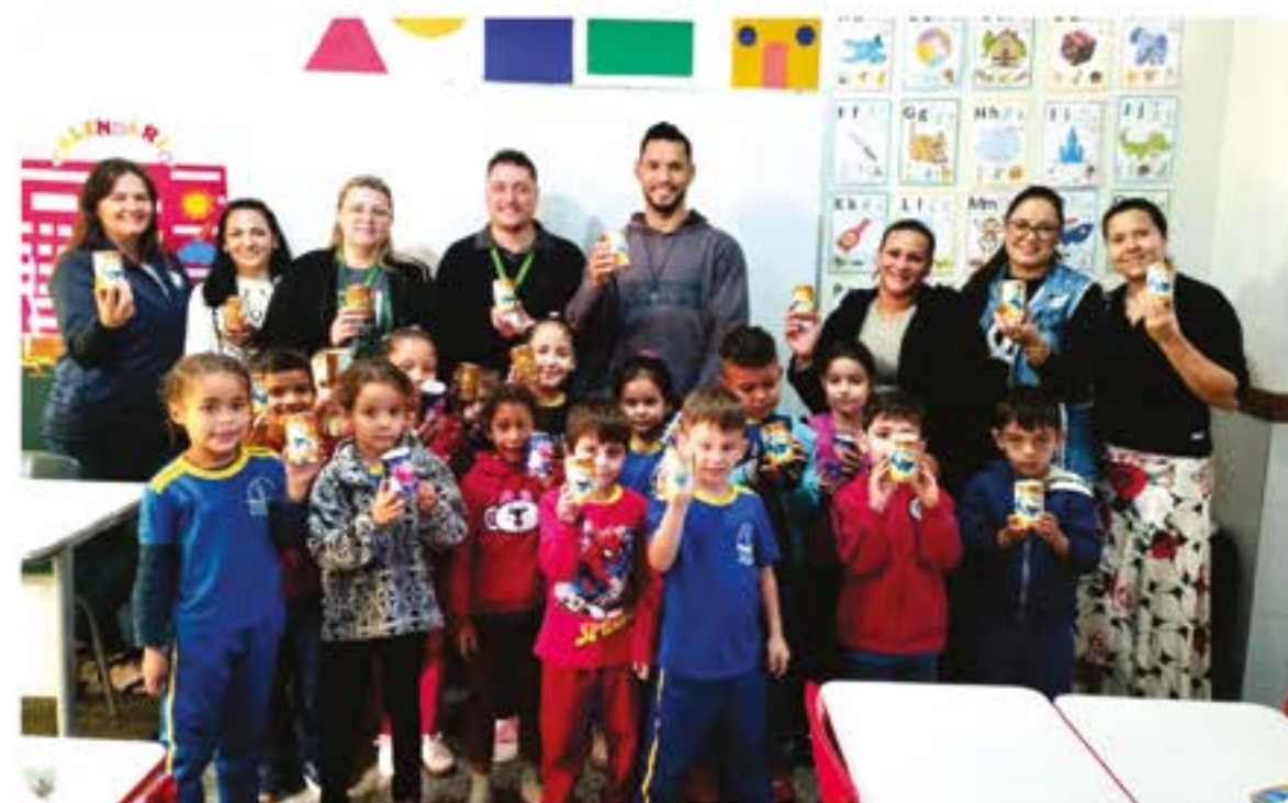
Projeto de educação financeira realizado no Centro Municipal de Educação Infantil Maria Alice de Barros.

Foram distribuídos cofrinhos para os alunos, com o intuito de incentivá-los a poupar e posteriormente realizarem algum desejo pessoal.