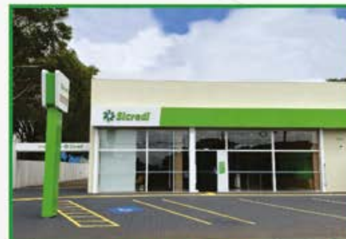
Foz - Porto Meira