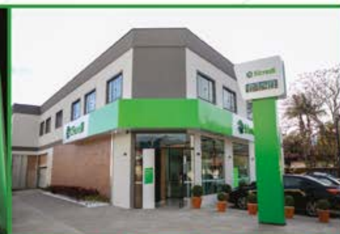
São Bento do Sapucaí