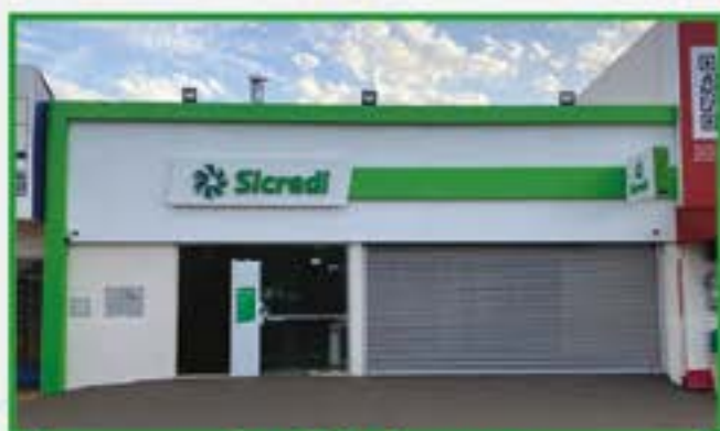
Foz Três Lagoas