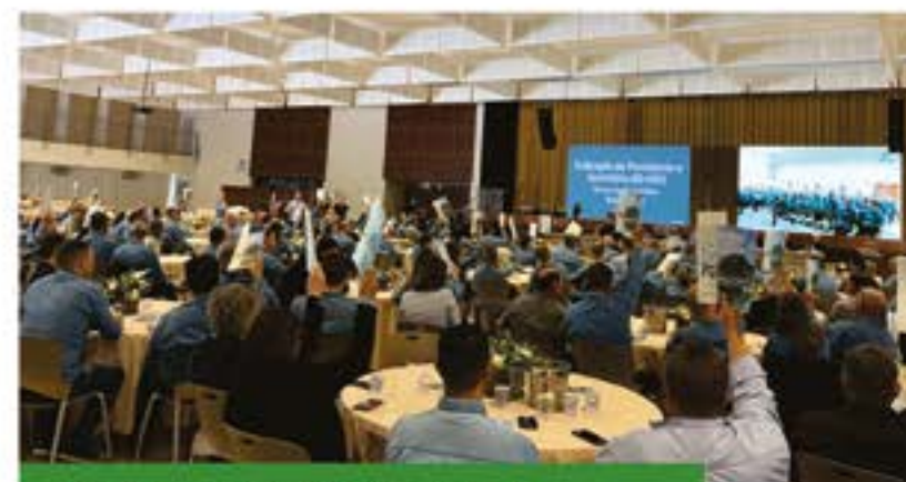
Um dos momentos de aprovação dos itens da ordem do dia pelos coordenadores

O associado pessoa física eleito em assembleia de núcleo, encarregado de promover diálogo sobre a gestão e o desenvolvimento da cooperativa e representar os associados do seu núcleo nas assembleias gerais.