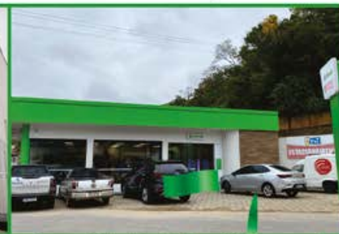
São Luiz do Paraitinga