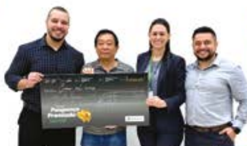
AG 55 - Foz República Sadao Iamachita