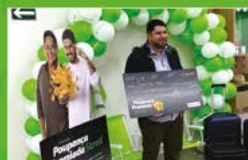
AG 68 - São José dos Campos MPS Robotica e Automação Ltda