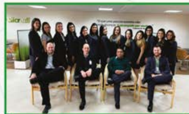
Cascavel Santo Antônio