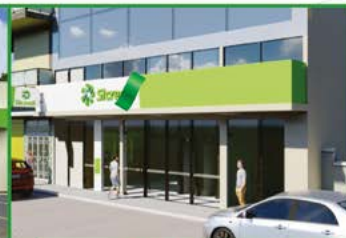
Barra do Pirai