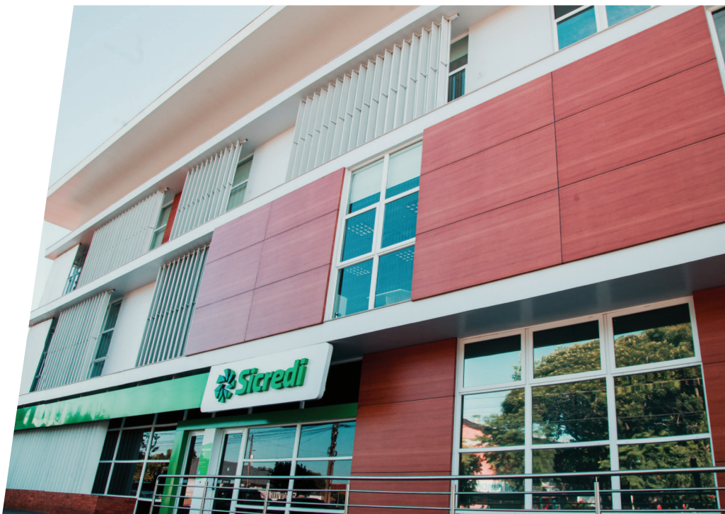
Sede da Sicredi União RS/ES

Com esse programa estimulamos nossos associados a fazerem parte das decisões do Sicredi. Assim, trazemos mais transparência e colocamos em prática o nosso modelo de gestão colaborativa, no qual os associados participam de reuniões, assembleias e outros eventos.