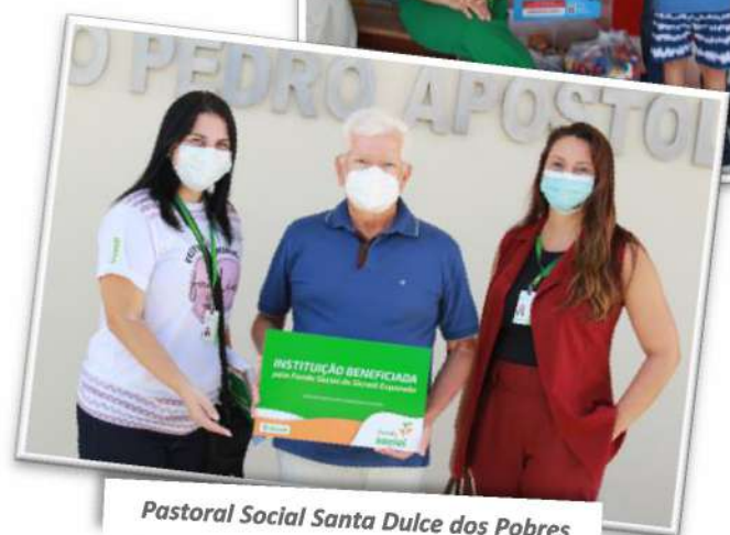
Pastoral Social Santa Dulce dos Pobres