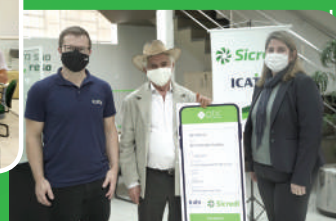
Associados contratam seguros e comemoram premiação