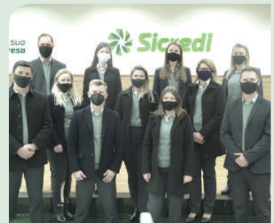
Equipe de colaboradores da agência de Mato Leitão

A Sicredi Integração RS/MG está em Mato Leitão desde 1999, tem atualmente 11 colaboradores, 3.751 associados e é uma das 22 agências da região de atuação.