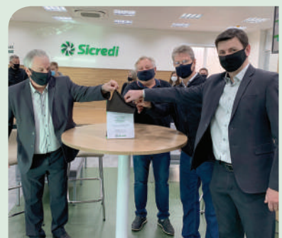
Ato simbólico marcou reinauguração