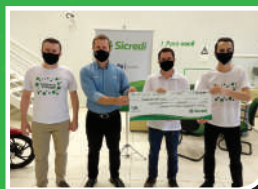
Entre os prêmios recentes, um vale no valor de R$ 50 mil