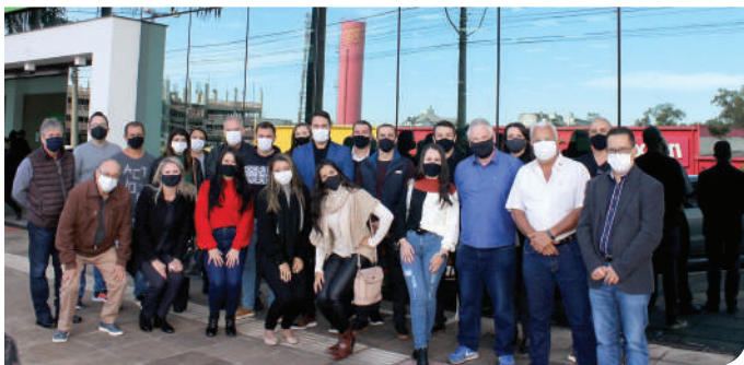
Grupo esteve em Lajeado e região em junho

Mais uma comitiva de Minas Gerais conheceu o centro administrativo da Sicredi Integração RS/MG, em Lajeado (RS), no começo de junho. Composto por colaboradores e lideranças do município de Congonhas, onde recentemente foi inaugurada uma agência, o grupo de 16 pessoas acompanhou uma explanação sobre a atuação e desempenho da