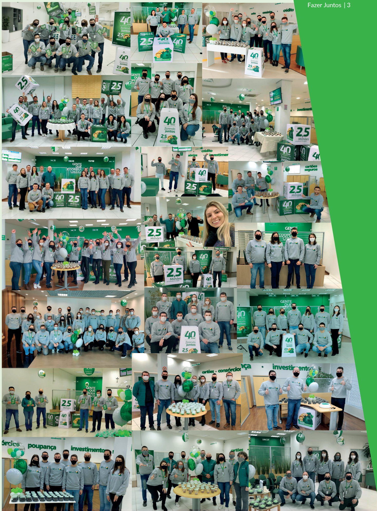
Equipe do Sicredi Região dos Vales no lançamento da Promoção nas agências.