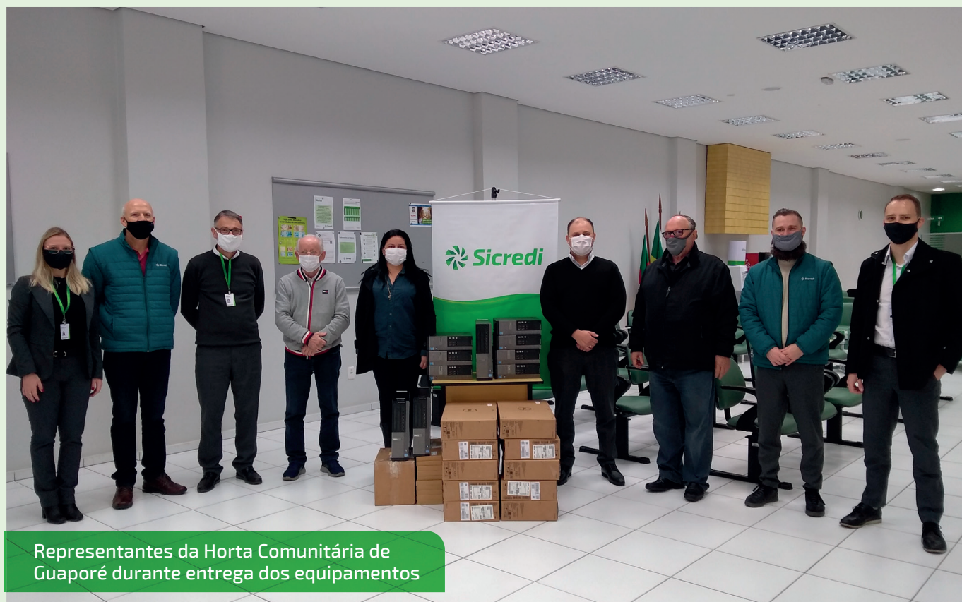
Representantes da Horta Comunitária de Guaporé durante entrega dos equipamentos

atenderão as demandas da instituição, “ hoje, esses computadores estão sendo utilizados pelos colegas lotados nos municípios de abrangência da cooperativa, pra viabilizar aos produtores o acesso ao crédito, a elaboração de relatórios, de laudos, entre outros. Agradecemos imensamente a parceria da Cooperativa Sicredi Região dos Vales, sempre disponível, acessível e comprometida com o bom atendimento aos agricultores e desenvolvimento da região. ”