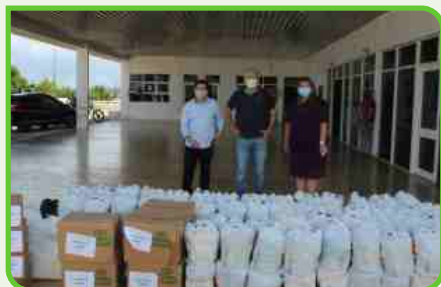
Prefeitura de Patos