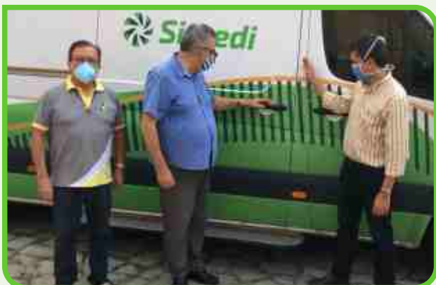
Igreja Menino Jesus de Praga