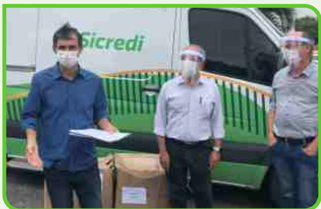
Prefeitura de Campina Grande