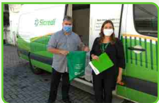
OCB/SESCOOP-PB - Organização das Cooperativas Brasileiras

Atuamos fortemente junto às cooperativas e instituições privadas parceiras com doações de equipamentos de proteção individual, objetivando fazer juntos a diferença.