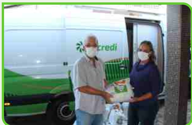
Prefeitura de Cabedelo