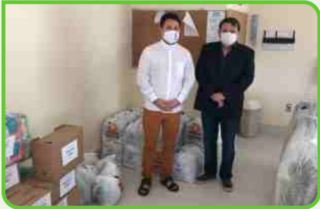
Igreja Nossa Senhora de Nazaré