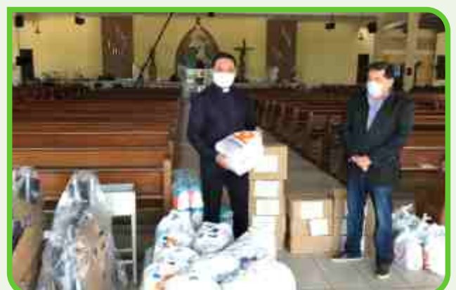
Santuário Mãe Rainha