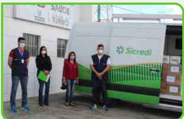
Prefeitura de Mamanguape