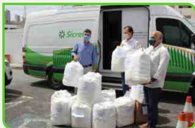
Prefeitura de João Pessoa