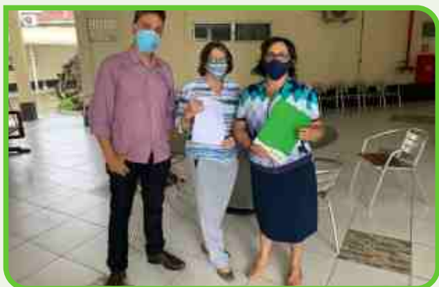
Hospital Flávio Ribeiro

A fim de contribuir com a implantação dos protocolos e minimizar os efeitos do Coronavírus, fizemos o levantamento das necessidades de hospitais de João Pessoa e realizamos a compra dos EPIs necessários para os protocolos e proteção dos profissionais que atuaram na linha de frente. Da mesma maneira, clínicas também foram beneficiadas com a doação significativa de EPIs.