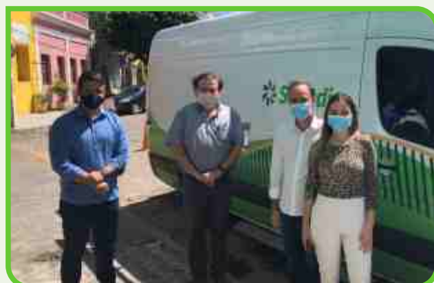
Prefeitura de Bananeiras