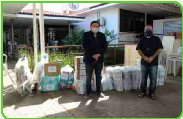
Filhos da Misericórdia