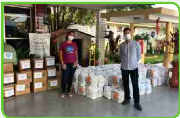
Hospital Padre Zé