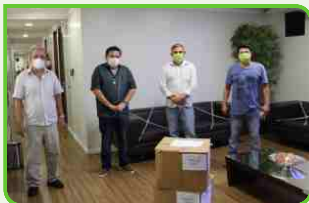
COOPERCON - Cooperativa de Construção Civil do Estado PB