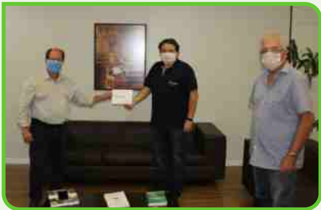
Unimed João Pessoa