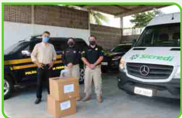
Polícia Rodoviária Federal