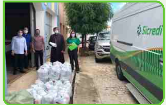
Arquidiocese de Patos

Nós contribuímos com as várias comunidades e igrejas com doações importantes.