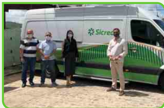
Prefeitura de Guarabira