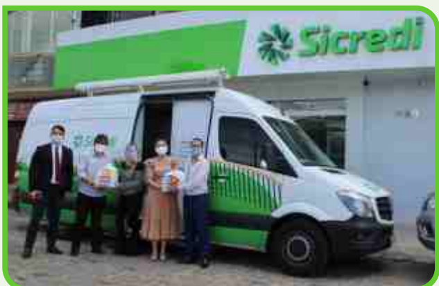
Prefeitura de Solânea