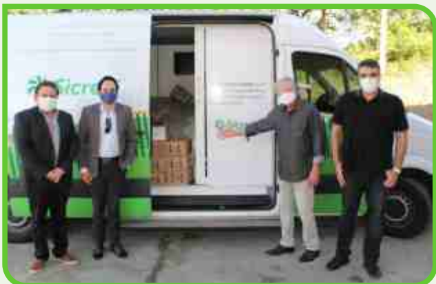
Primeira Igreja Batista