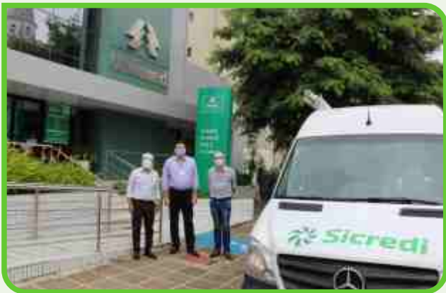
Unimed Campina Grande