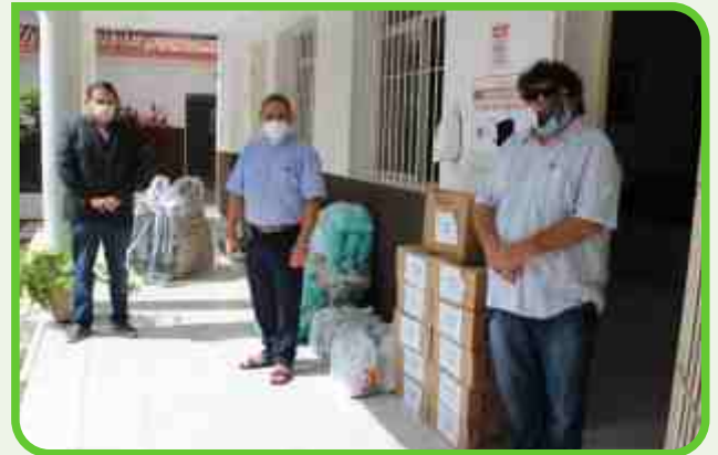
Igreja Santa Júlia