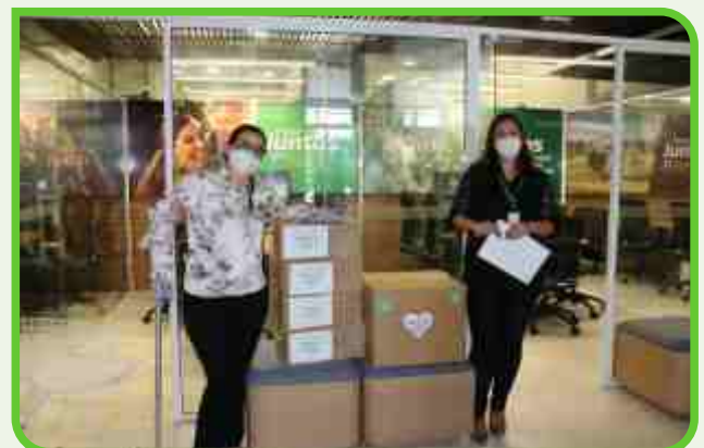
Igreja Batista Nacional