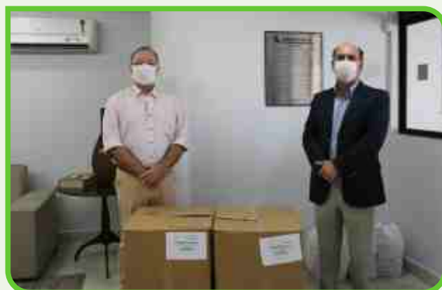
Sinduscon - Sindicato da Indústria da Construção Civil