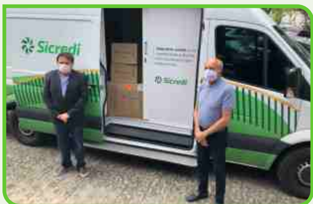
Governo do Estado

Atuamos de forma responsável, colaborando sempre com a região onde atuamos, e de maneira ágil, buscamos fornecedores e efetuamos as compras dos materiais solicitados para atender às demandas dos órgãos públicos nesse momento delicado.