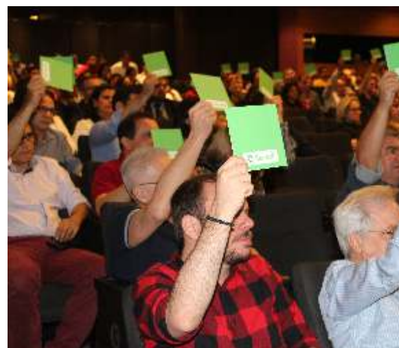
Assembleia Sicredi Evolução