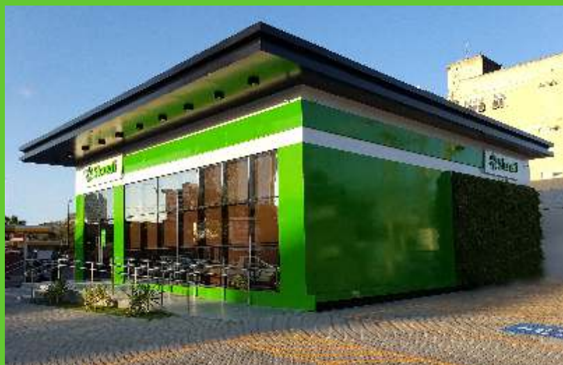
Agência Catolé Campina Grande